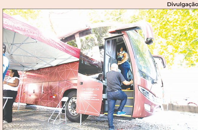
Ação integra comemorações do Mês da Mulher

São João da Barra prorroga novamente o vencimento da cota única e da primeira parcela do IPTU, previstos para 31 de março. A nova data de vencimento é 28 de abril. O desconto de 20% está mantido para a cota única. No entanto, o parcelamento só poderá ser feito em nove vezes.