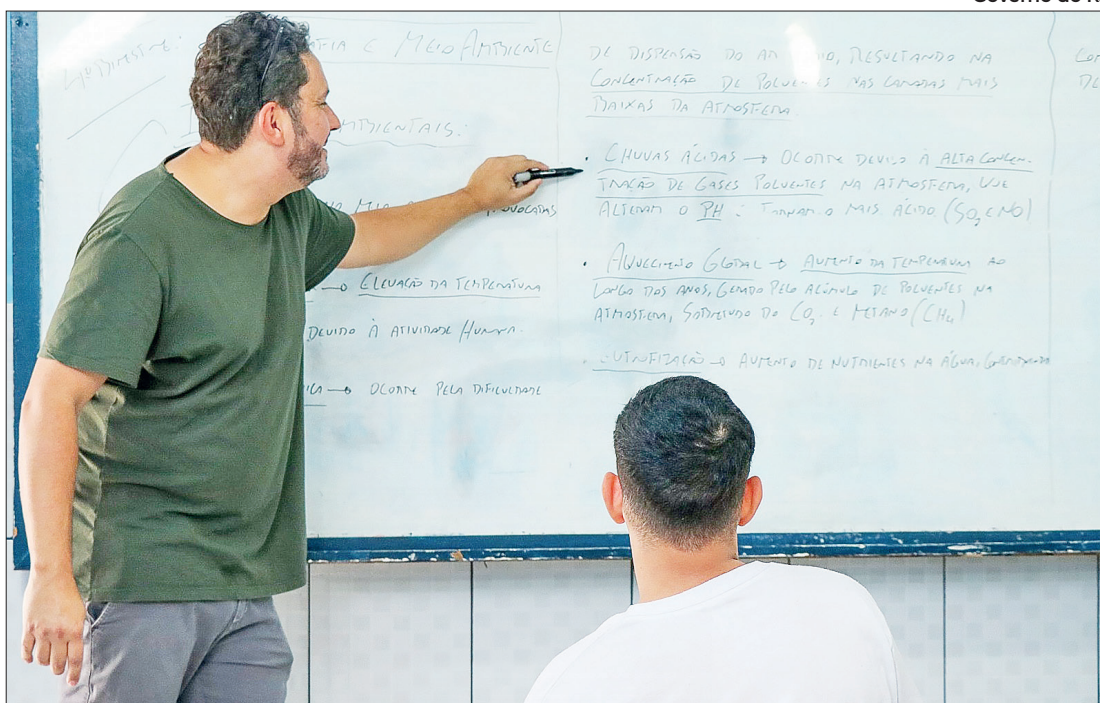
Governo do RJ Contratação dos novos profissionais terá cotas para PCDs, negros e índios

Uma mega operação realizada pelo Inea, com o apoio da Prolagos, desmontou nesta terça-feira (28), três pontos de abastecimento irregular em Cabo Frio. Dois locais no bairro Jardim Esperança eram utilizados para abastecer caminhões pipa ilegalmente.