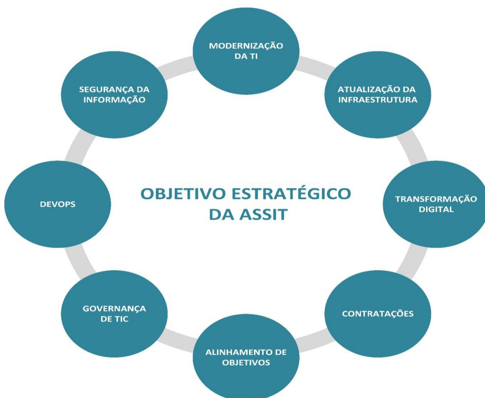
Figura - Objetivos estratégicos de TIC

Visando um avanço significativo em suas operações e adaptando-se às inovações tecnológicas, a modernização da TI é um pilar fundamental para garantir que a organização aproveite ao máximo as tecnologias disponíveis. Isso envolve substituir sistemas legados por soluções mais eficazes e fortalecer nossa segurança digital. Paralelamente, a atualização da infraestrutura é essencial para suportar essas novas aplicações e atender às crescentes demandas. Para alcançar esses objetivos, é necessário implementar práticas ágeis e revisar todos os nossos processos de TI, garantindo assim a transparência e a conformidade regulatória.