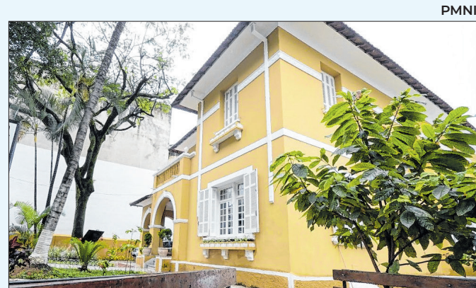
Casa de Cultura está recebendo essa exposição curiosa