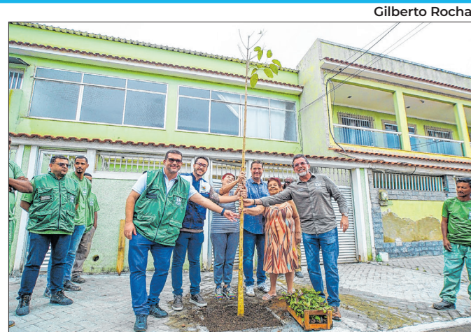
Programa prevê o plantio inicial de 10 mil árvores