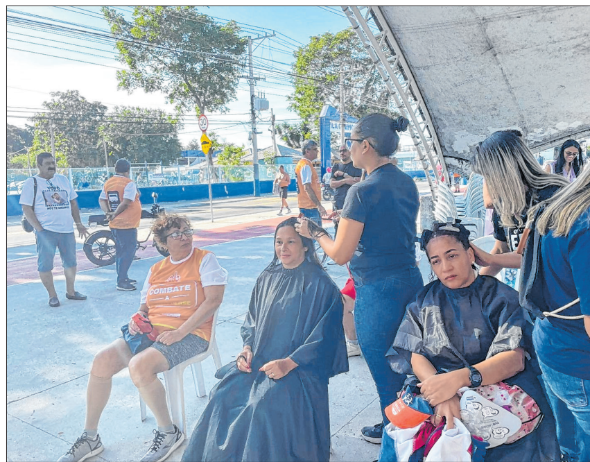
Ação contou com serviços de beleza, vacinação, orientações médicas e assistenciais à população

Com a participação da Secretaria de Estado de Saúde, foram realizadas testagem para HIV, sífilis e hepatites virais. A iniciativa contou com a colaboração de organizações da sociedade civil, incluindo as ONGs Associação Centro Social Fusão, CHM Sem Bacilo, Associação de Mulheres de Edson Passos e Adjacências (AMEPA) e Associação de Gays e Amigos