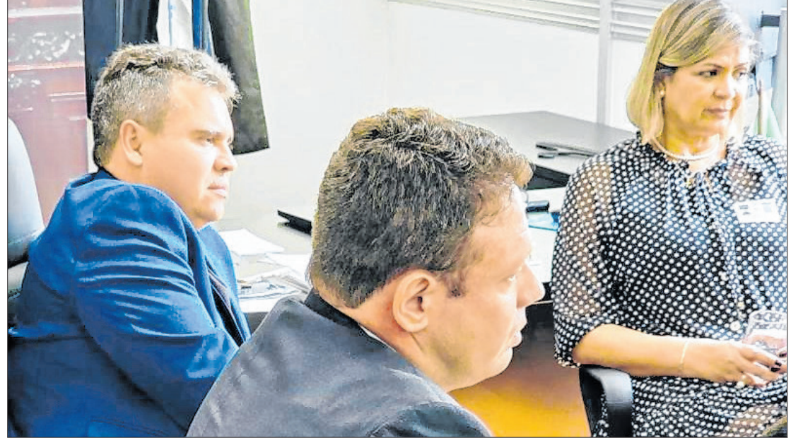
Proposta prevê uso do Fundo Especial do Judiciário para modernizar instituições jurídicas

“A advocacia pública municipal é essencial para o funcionamento da Justiça e precisa de meios adequados para atuar com eficiência. Hoje, o custeio das procuradorias recai exclusivamente sobre os municípios, o que gera grande desequilíbrio”,