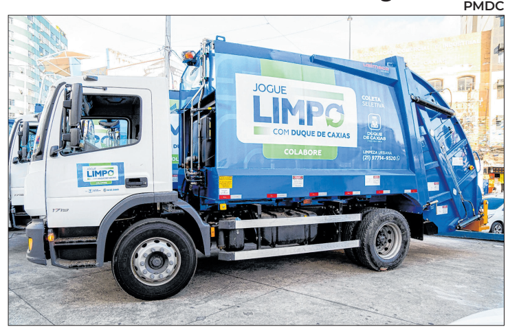
Prefeitura revolucionou a limpeza urbana de Caxias

O processo começa com a separação dos materiais nesses pontos estratégicos e segue com a coleta feita por modernos caminhões elétricos, que transportam os resíduos até o CTR. A ação conta ainda com a parceria de cooperativas de catadores, responsáveis por dar o destino final sustentável aos resíduos recicláveis. De início, um caminhão elétrico atenderá o