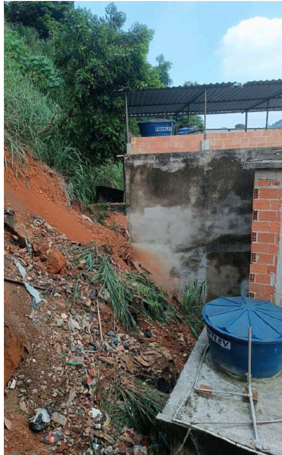
Imagem 4 - Vista da área de intervenção