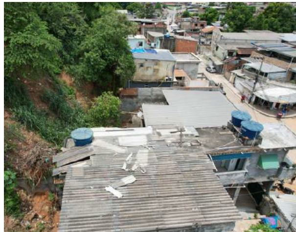
Imagem 3 - Vista da área de intervenção