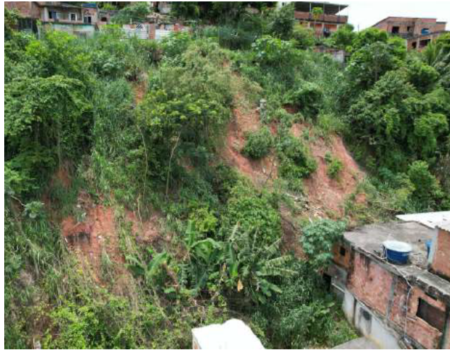
Imagem 2 - Vista da área de intervenção