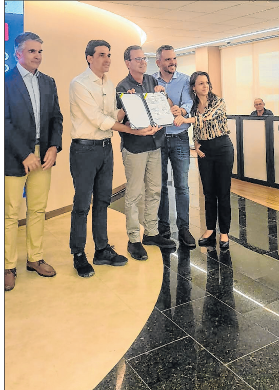
Paes com o ministro e o novo contrato

Também está prevista a cobrança de uma contribuição variável de 20% do faturamento bruto da concessionária até 2039, além da criação de uma compen-