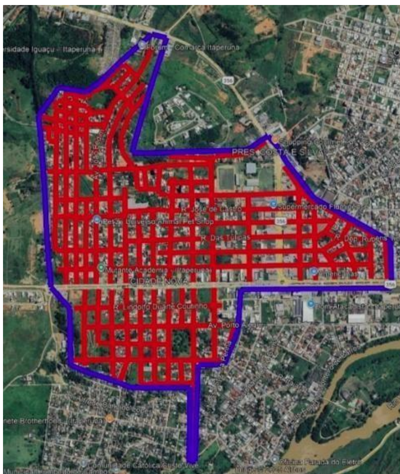
Figura 01: Ruas a receberem pavimentação no bairro da Cidade Nova, Presidente Costa e Silva e João Bedim