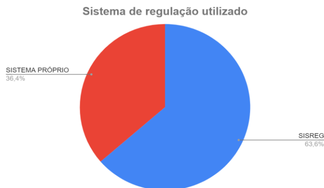
Gráfico 01: Sistemas de Regulação da RCSF