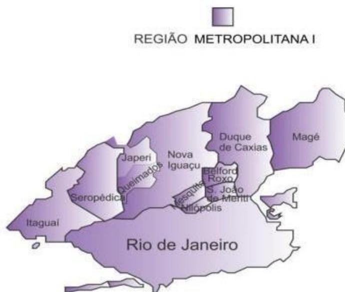
Figura 1: Mapa da Região Metropolitana 1