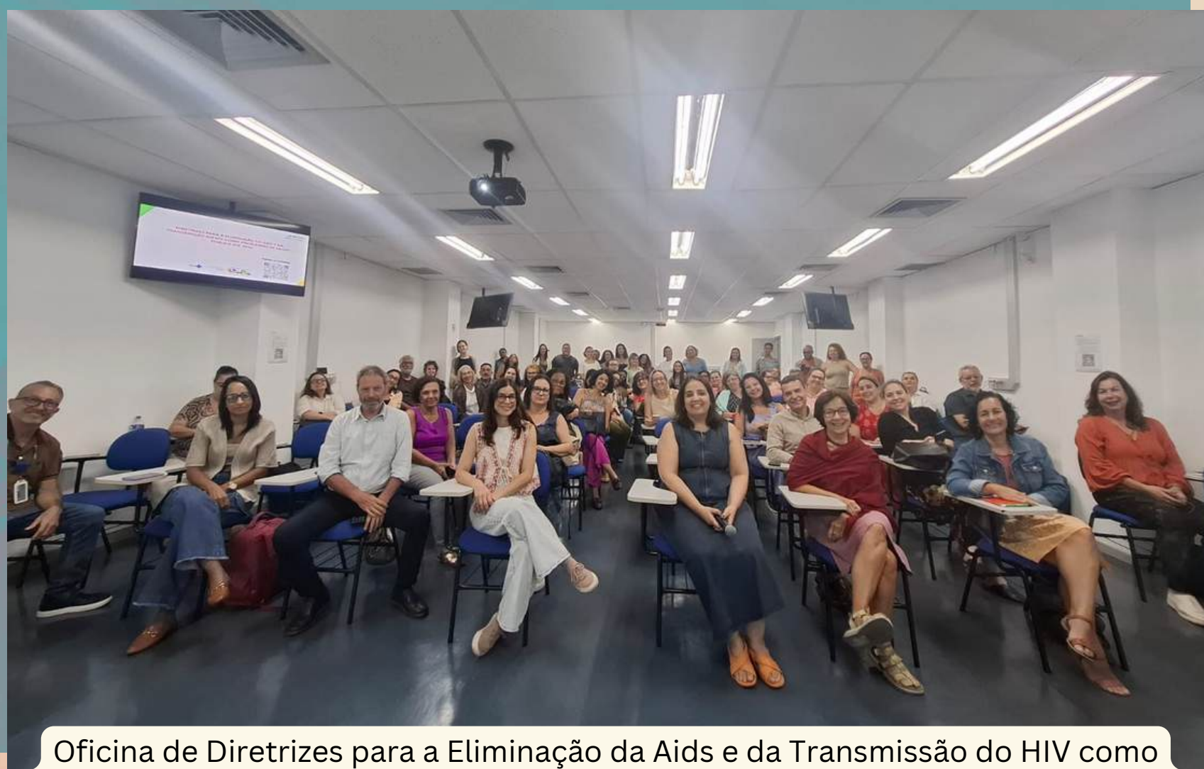
Oficina de Diretrizes para a Eliminação da Aids e da Transmissão do HIV como Problemas de Saúde Pública até 2030, Rio de Janeiro, 28 e 29 de janeiro de 2026.

Nos dias 28 e 29 de janeiro a GERIAIDS reuniu, no espaço da Escola de Contas e Gestão do Tribunal de Contas do Estado do Rio de Janeiro (TCE-RJ), gestores de programas de IST/HIV/aids das esferas municipal, estadual e federal, ativistas e representantes de organizações da sociedade civil (OSC) para a construção coletiva de um planejamento de ações integradas de enfrentamento ao HIV e à aids a serem implementadas em âmbito local. A iniciativa tem em vista o alcance das metas de eliminação da aids e da transmissão do HIV como problemas de saúde pública até 2030.