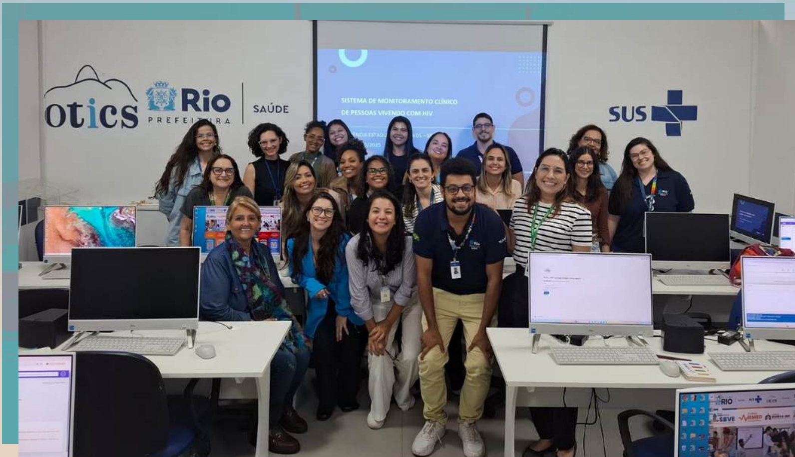
Treinamento no uso do SIMC aos preceptores de residentes da APS do Rio de Janeiro-RJ, 22/01/2026.

A GERIAIDS vem atuando em parceria com as Gerências de IST/AIDS e de Doenças Pulmonares Prevalentes do município do Rio de Janeiro, com o propósito de qualificar a atenção às pessoas que vivem com HIV e aids (PVHA) e com tuberculose (TB), bem como de prevenir novos casos de coinfeção TB-HIV por meio da ampliação da realização do Tratamento Preventivo da Tuberculose (TPT) . O uso do Sistema de Monitoramento Clínico das Pessoas Vivendo com HIV (SIMC) pelos profissionais da Atenção Primária à Saúde (APS) é uma estratégia fundamental para atingir este objetivo.