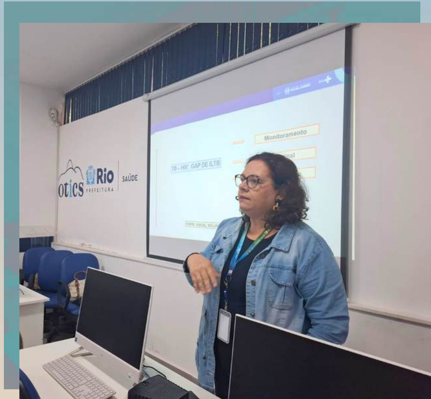
Treinamento no uso do SIMC a profissionais da APS do Rio de Janeiro-RJ, 22/01/2026.

Os primeiros treinamentos presenciais de 2026 foram realizados em 22 de janeiro, em laboratórios de informática disponibilizados pela Secretaria Municipal de Saúde do Rio de Janeiro (SMS-Rio). Pela manhã, a capacitação foi destinada a apoiadores de TB e a facilitadores do projeto de cooperação técnica entre a SES-RJ e a Organização Pan-Americana da Saúde (OPAS) para o enfrentamento da tuberculose no ERJ , que estão lotados em todas as áreas programáticas do município. No segundo turno, participaram preceptores das residências de Enfermagem e Medicina que atuam nas Clínicas da Família . A definição do público das capacitações ocorreu em articulação com as gestoras locais, considerando o papel estratégico desses profissionais na qualificação das ações e na multiplicação do conhecimento.