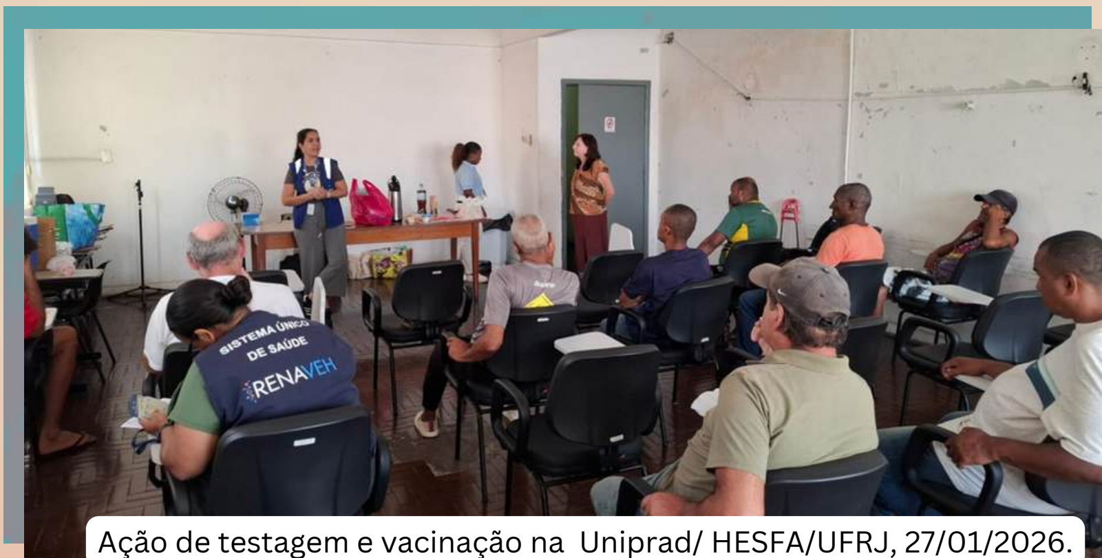
Ação de testagem e vacinação na Uniprad/ HESFA/UFRJ, 27/01/2026.

No dia 27 de janeiro de 2026, a Gerência de Hepatites Virais (GERHV) da SES-RJ realizou uma ação estratégica de testagem e vacinação no Núcleo de Atenção às Pessoas com Problemas de Álcool e Outras Drogas (Uniprad) do Hospital Escola São Francisco de Assis (Hesfa/UFRJ). A atividade faz parte de um projeto piloto que visa observar as condições para a futura implementação sistemática da testagem rápida de ISTs nos Centros de Atenção Psicossocial Álcool e Drogas (Caps AD) do estado.