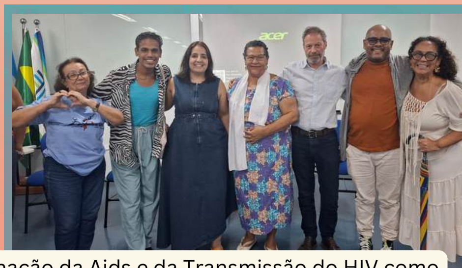
Oficina de Diretrizes para a Eliminação da Aids e da Transmissão do HIV como Problemas de Saúde Pública até 2030, Rio de Janeiro, 28 e 29 de janeiro de 2026.