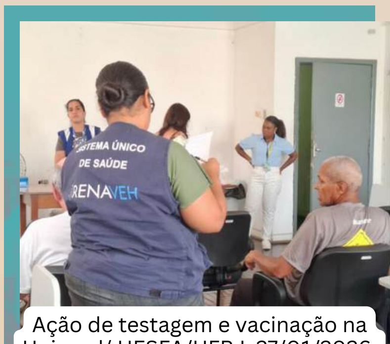
Ação de testagem e vacinação na Uniprad/ HESFA/UFRJ, 27/01/2026.

A necessidade desta política pública é sustentada por dados epidemiológicos do estado coletados entre 2019 e 2025, que registraram 794 casos de hepatite C entre usuários de drogas inaláveis e 412 casos entre usuários de drogas injetáveis. Além disso, a experiência identificou que, sob o efeito de substâncias, muitos usuários negligenciam o uso de preservativos, o que reforça a urgência de descentralizar o diagnóstico para locais de acolhimento e redução de danos.