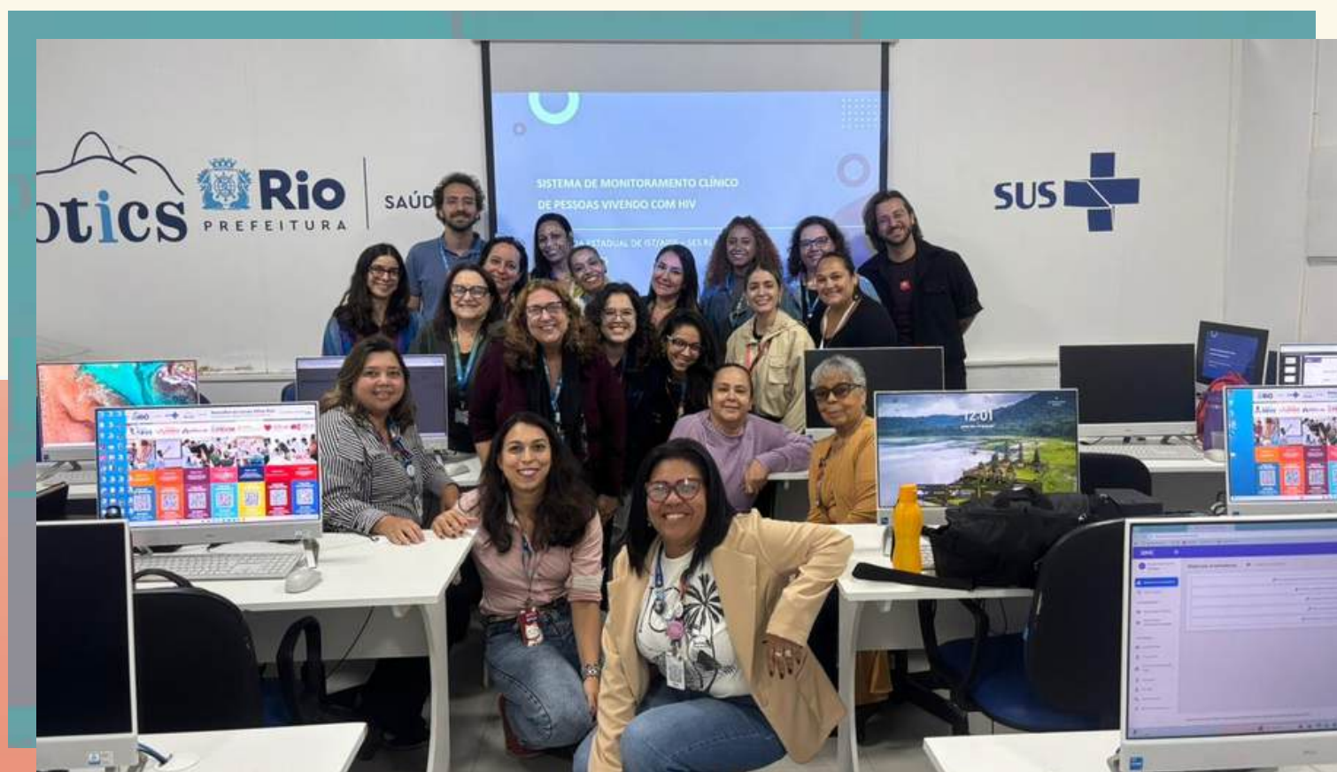
Treinamento no uso do SIMC aos apoiadores de TB da APS do Rio de Janeiro-RJ, 22/01/2026.

GERIAIDS REALIZA TREINAMENTOS NO USO DO SIMC A APOIADORES DE TUBERCULOSE E PRECEPTORES DE RESIDENTES DA ATENÇÃO PRIMÁRIA DO RIO DE JANEIRO-RJ