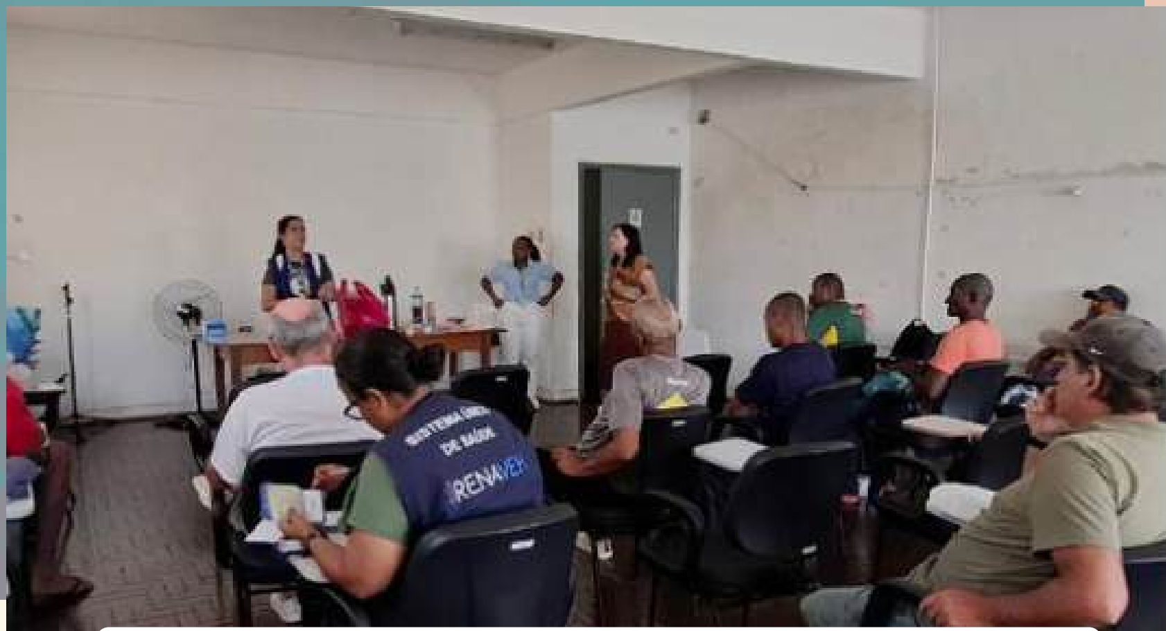
Ação de testagem e vacinação na Uniprad/ HESFA/UFRJ, 27/01/2026.

do, a SES-RJ busca alinhar o estado às metas globais da Organização Mundial da Saúde para a eliminação das hepatites virais até 2030, garantindo que populações historicamente marginalizadas tenham acesso direto ao diagnóstico e ao tratamento.