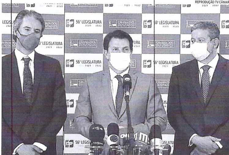
Arthur Maia (ao centro), Fernando Monteiro e Arthur Lira dizem que a proposta modernizará o Estado

“A preocupação é de evitar qualquer tipo de perseguição política. Para isso, criamos elementos, o primeiro é a avaliação realizada no âmbito de uma plataforma digital, o Gov.br”. O relator disse ainda que a plataforma será disponibilizada às prefeituras e estados.