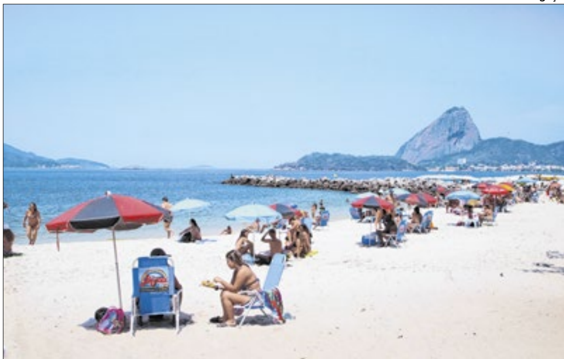
A primeira vez que este fenômeno aconteceu foi em 2023

"Inclusão não pode ficar de fora das escolas. Quando a gente leva o esporte paralímpico para dentro das salas de aula, a gente mostra que todo mundo pode sonhar, superar limites e aprender o valor da igualdade e do respeito", disse o governador.