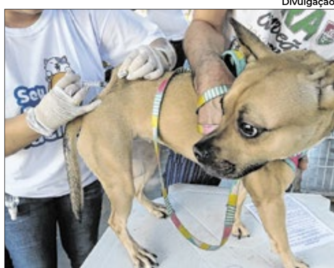
Campanha de vacinação foi no sábado, dia 20