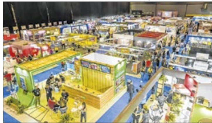
Resultado é 7,2% maior em comparação a 2024

"O franchising se consolidou como uma das grandes forças da nossa economia, por aliar inovação, geração de empregos e dinamização do comércio em todas as regiões do estado. Esse desempenho mostra que o Rio de Janeiro é um terreno fértil para novos negócios, que encontram aqui um público