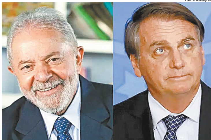
No Nordeste, vantagem de Lula sobre Bolsonaro era maior em junho

De acordo com a pesquisa divulgada ontem, no Nordes-