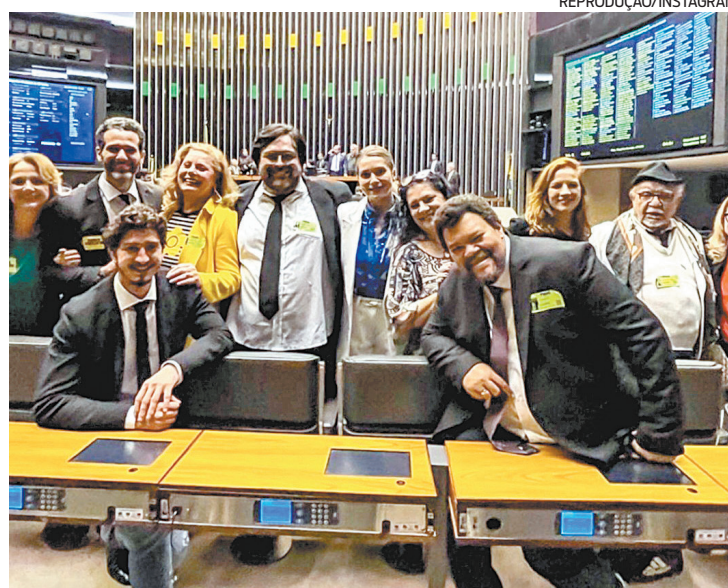
‘Bancada’ do setor cultural festeja derrubada dos vetos de Bolsonaro

Após uma série de adiamentos da votação, a ofensiva da classe artística ecoou em Brasília e superou a ‘surdez’ e apatia do Planalto sobre o tema. A aprovação dos auxílios ao setor cultural prevê, via Lei Aldir Blanc 2,