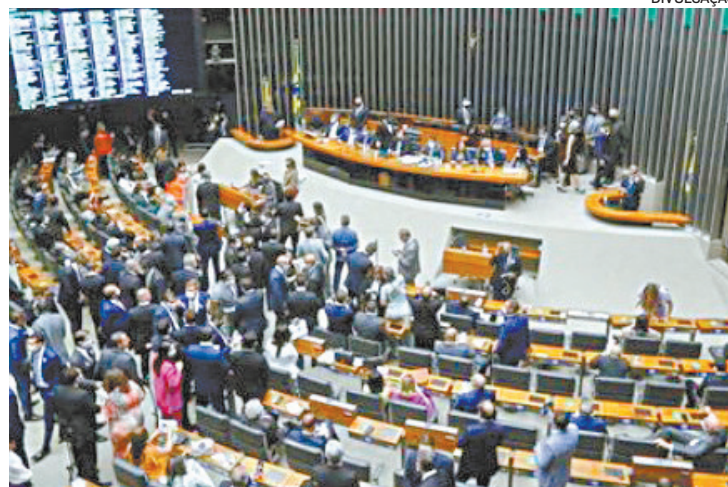
Plenário da Câmara: texto deve ser votado a partir de hoje

O relator chegou a dizer que negociava incluir um auxílio-gasolina a motoristas de aplicativo, como o Uber, e re-