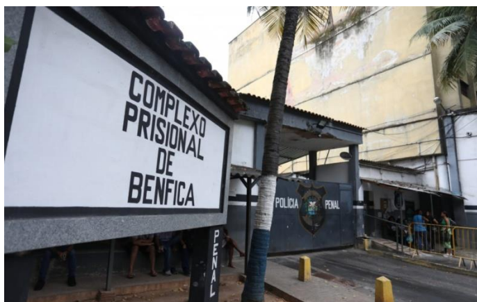
Figura I – Entrada do Complexo de Benfica, que dá acesso à Unidade SEAP/FM e à CEAC