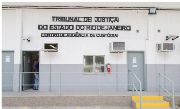
Figura 2 – CEAC de Benfica, localizada em prédio anexo à unidade prisional SEAP/FM