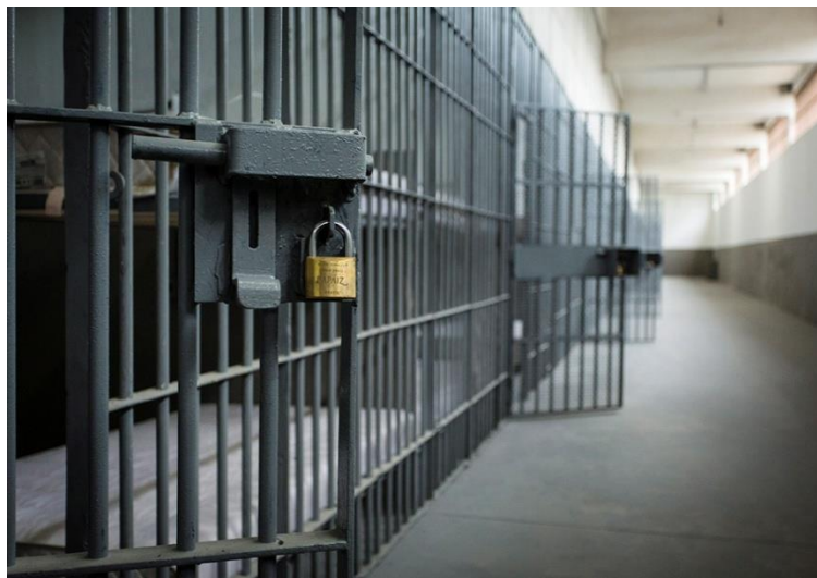
Figura 5 – Galeria da unidade prisional SEAP/FM