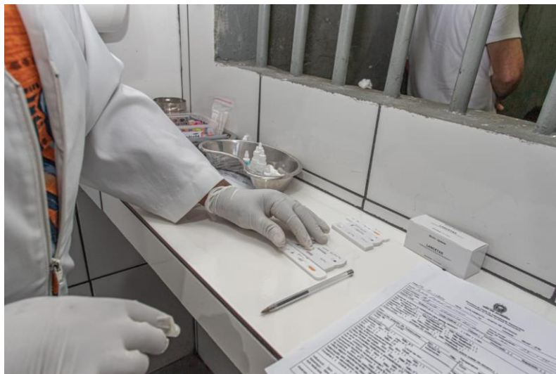
Figura 4 – Sala de Acolhimento de Saúde da unidade prisional SEAP/FM