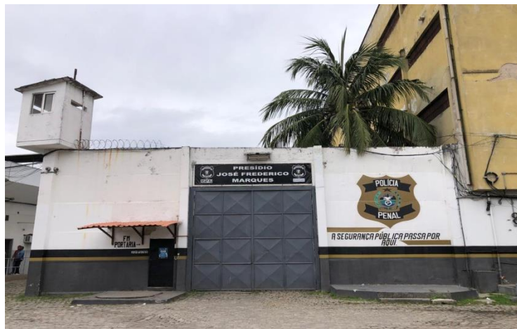
Figura 3 – Entrada da unidade prisional SEAP/FM