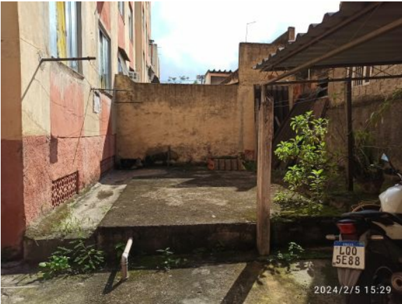
Figura 03: Pátio Edifício Sollar de Ville