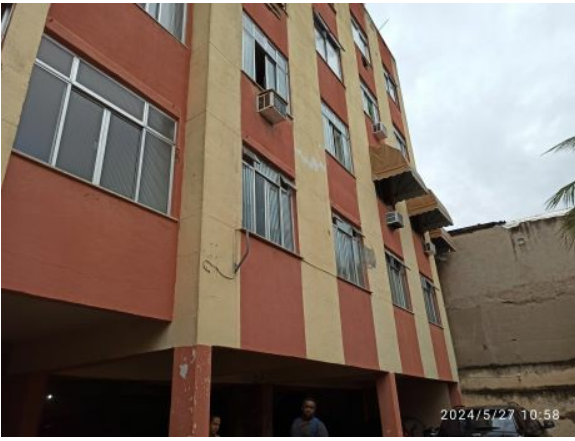
Figura 01: Fachada Edifício Rogério