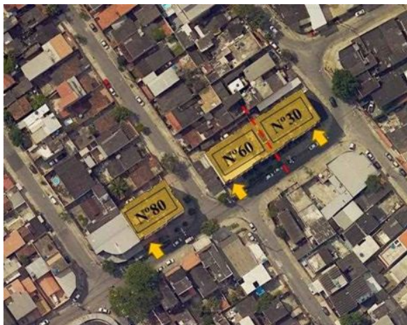
Figura 4: Conjunto Habitacional Rogerio, Santa Barbara e Sollar de Ville, com as indicações de acessos – Fonte: Google/2024

Condomínio Edifício Sollar de Ville, Rua Juarana nº 30, Bairro Anchieta - RJ CEP: 21630-230 / Parque Anchieta. (Coordenadas Geográficas: 22°49'33.07"S e 43°24'47.77"O).