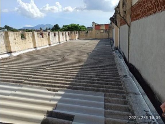
Figura 02: Terraço Edifício Santa Bárbara