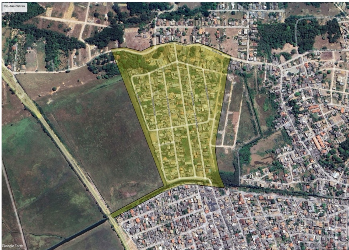
Figura 01: Imagem aérea do trecho de intervenção de Santa Helena em 02/2025.

Devido à ausência de levantamentos preliminares, bem como profissionais cuja expertise seja para elaborar estudos e projetos, tornou-se necessária a execução de ensaios na localidade que, sequencialmente, irão auxiliar no desenvolvimento dos projetos e na elaboração de memórias de cálculo e planilha orçamentária da obra.