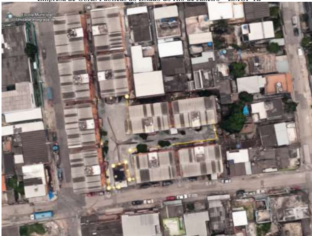
Figura 2: Conjunto Habitacional dos Eucaliptos, localizado entre as Ruas Floriana, Vhail Pereira e Joaquim Gomes Andrade, Coelho da Rocha, São João de Meriti - RJ

Governo do Estado do Rio de Janeiro Empresa de Obras Públicas do Estado do Rio de Janeiro – EMOP-RJ