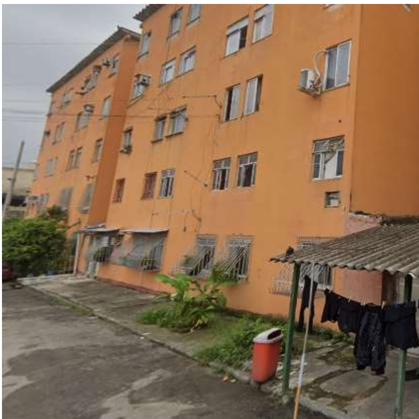
Figura 1: Conjunto Habitacional dos Eucaliptos, Coelho da Rocha – São João de Meriti - RJ

Este Projeto Básico estabelece condições técnicas para a contratação de empresa especializada para prestação de serviço de “Execução de Serviços de Reforma do Conjunto Habitacional dos Eucaliptos, localizado entre as Ruas Floriana, Vhail Pereira e Joaquim Gomes Andrade, Coelho da Rocha, São João de Meriti - RJ” . Foi elaborado conforme os requisitos do artigo 11 do Decreto estadual nº 46.642/2019.