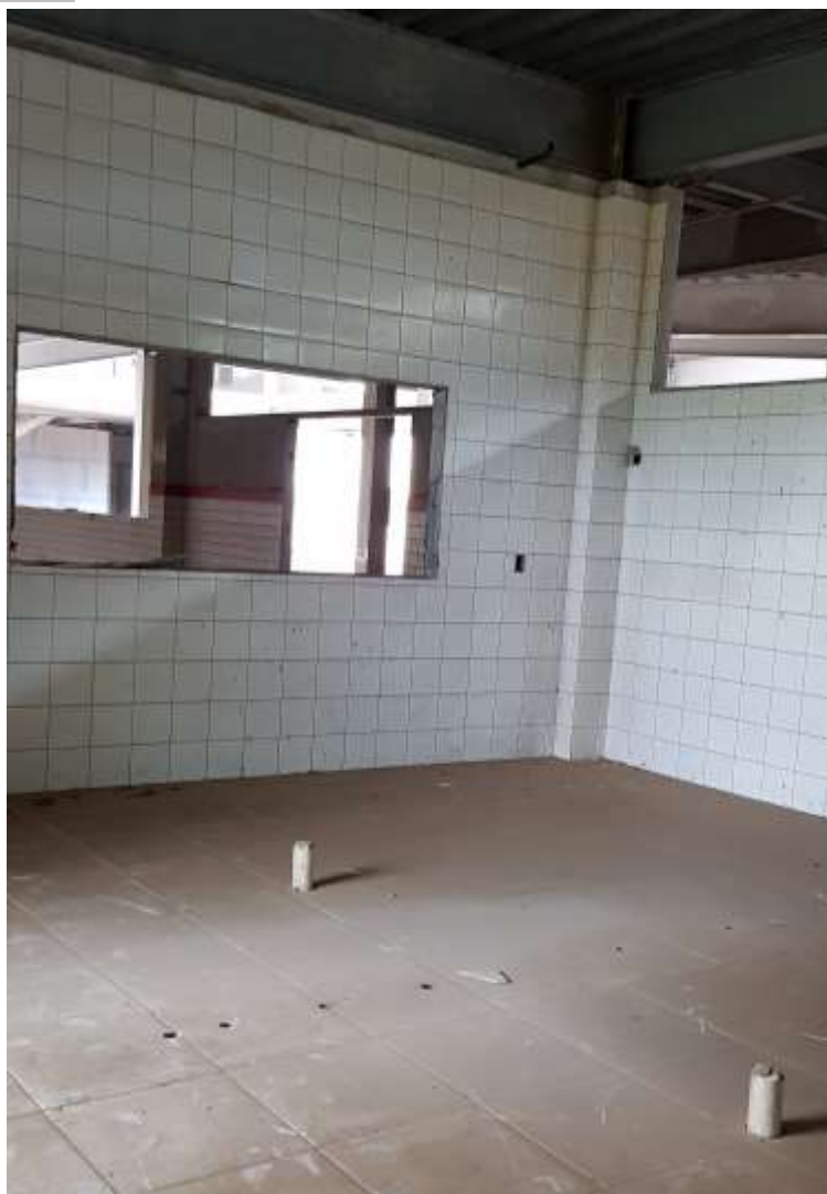
Vista interna da cozinha e ao fundo o refeitório

Piso: Piso cerâmico antiderrapante: Executado