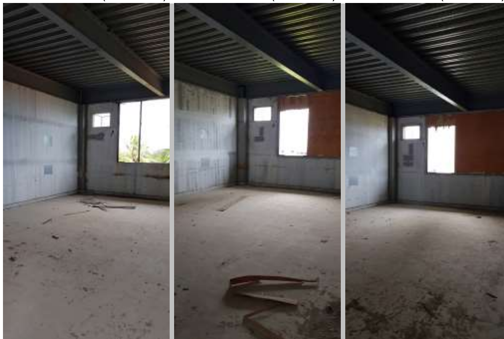
Sala de aula 14 (40 alunos) Sala de aula 15 (40 alunos) Sala de aula 16 (40 alunos)