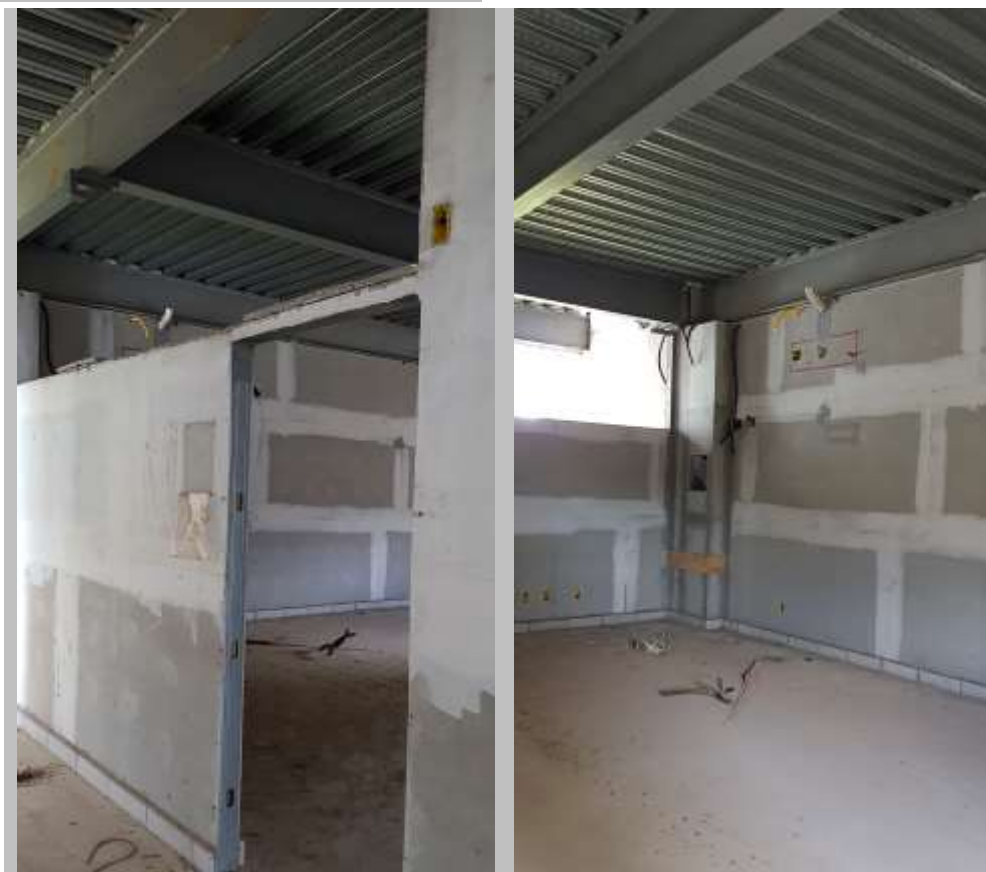
Laboratório de informática vista do acesso a sala e vista interna

Piso: Piso de alta resistência pré-moldado em placas 40x40x3 e rodapé h=10cm do mesmo material: Executado (Refazer o polimento devido à paralisação da obra)