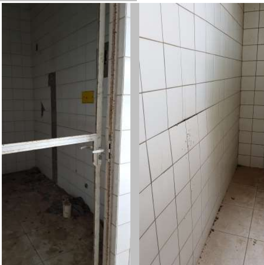
Vistas dos vestiários dos funcionários feminino e masculino

Piso: Piso cerâmico antiderrapante: Executado