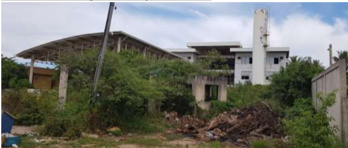
Entrada de pedestre e veículos com guarita