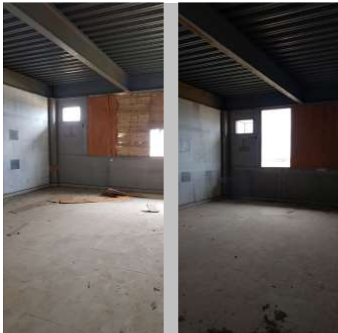
Sala de aula 17 (40 alunos) Sala de aula 18 (40 alunos)

C.E. CARLOS WALTER MARINHO CAMPOS (CE EM LAGOMAR)