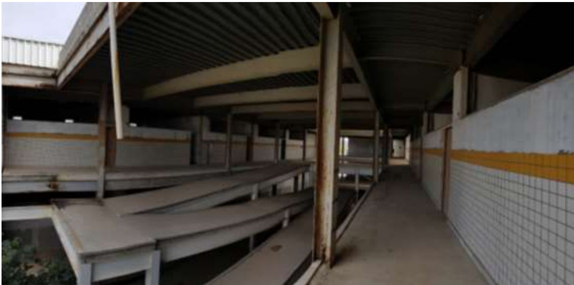
Circulação das salas de aula