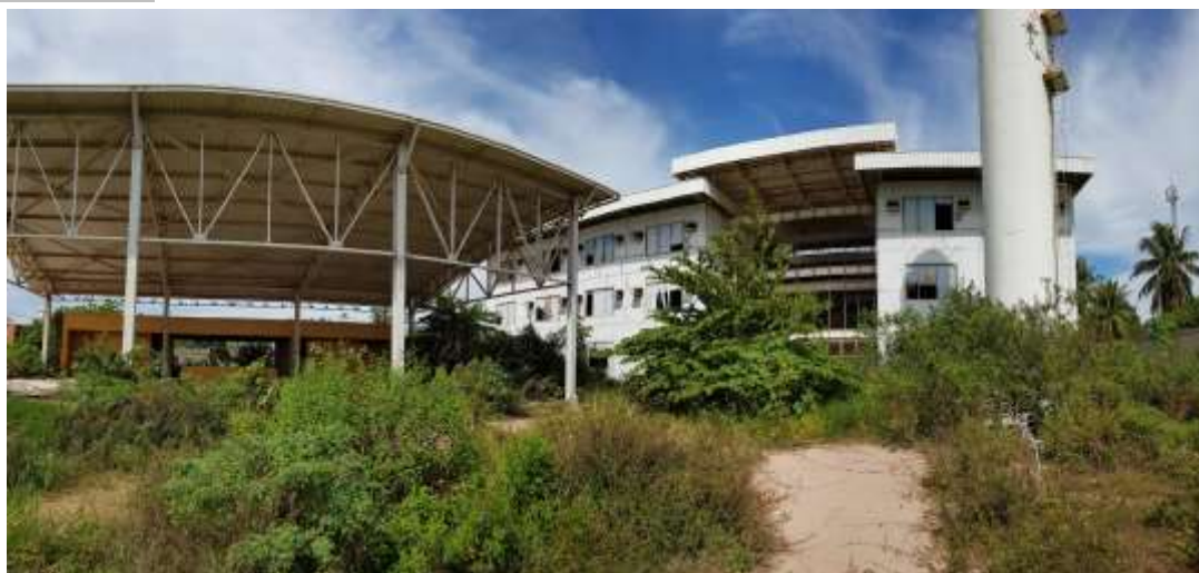
Acesso ao Bloco Principal e Quadra Poliesportiva

Piso: Pátio com piso intertravado: A executar