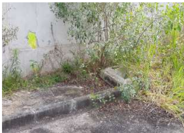
Cisterna de Água de reuso