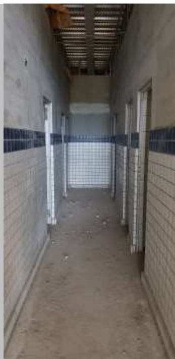
Circ. De serviços