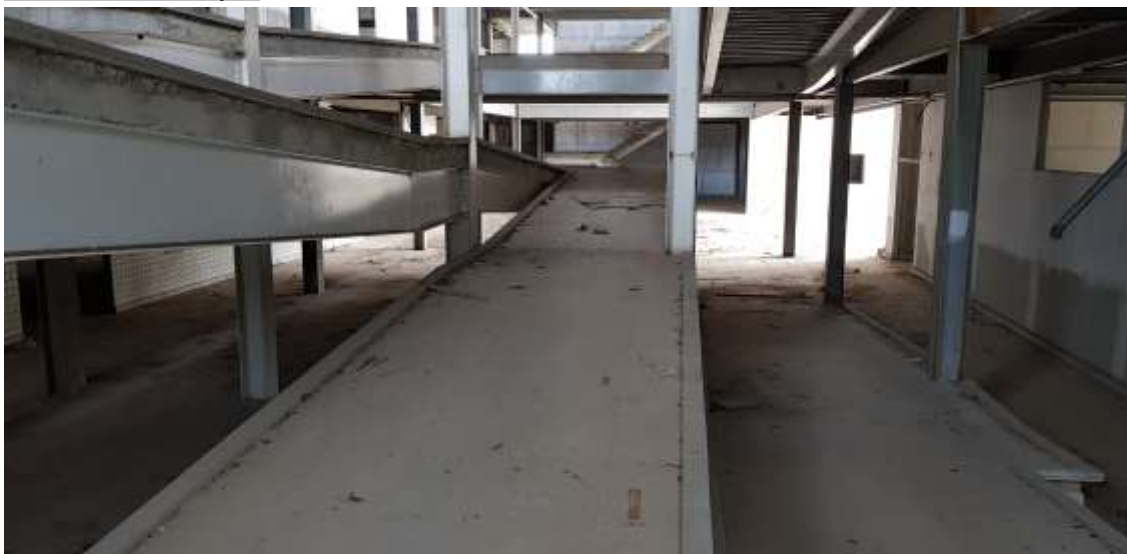
Vista da rampa do nível do térreo para o segundo pavimento

Colocação de luminárias de embutir: A Executar