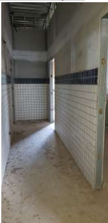
Circ.da área administrativa