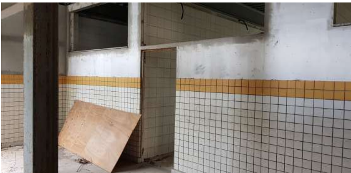
Circulação com a entrada da área de serviço

C.E. CARLOS WALTER MARINHO CAMPOS (CE EM LAGOMAR)