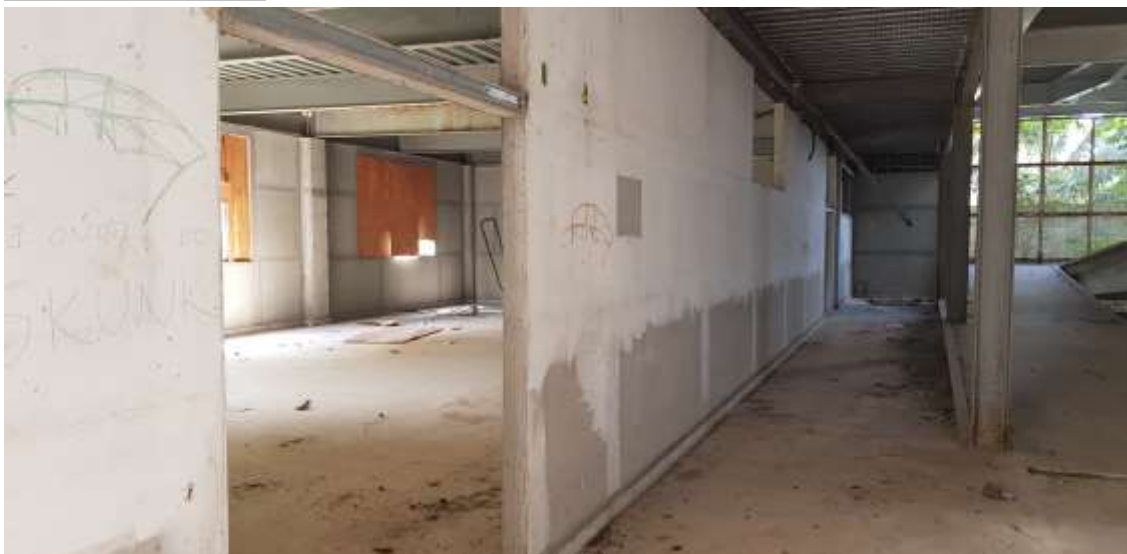
Vista da entrada do Auditório