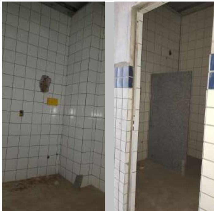
Vestibulo dos funcionários masculino e feminino

C.E. CARLOS WALTER MARINHO CAMPOS (CE EM LAGOMAR)