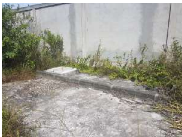
Cisterna de Água potável