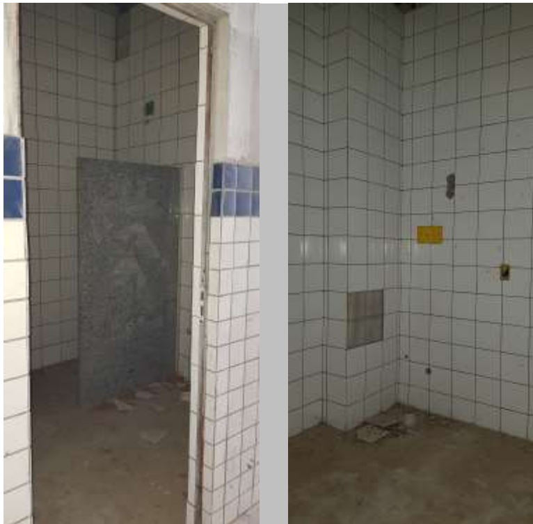
Vestiário dos professores masculino e feminino