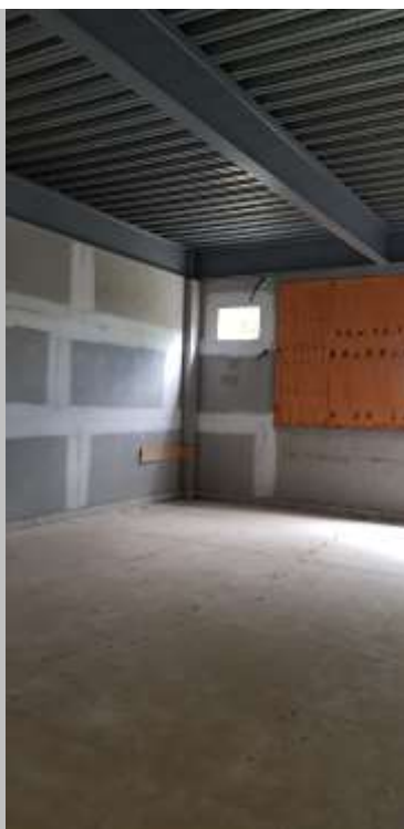
Sala de aula 02 (40 alunos)