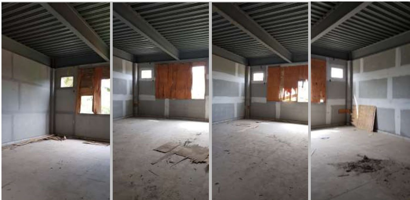
Sala de aula 04 (40 alunos) Sala de aula 05 (40 alunos) Sala de aula 06 (40 alunos) Sala de aula 07 (40 alunos)

Empresa de Obras Públicas do Estado do Rio de Janeiro