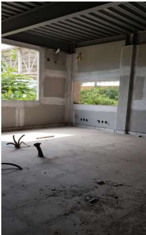
Vista interna da secretária

Piso: Piso de alta resistência pré-moldado em placas 40x40x3cm e rodapé h:10 cm do mesmo material: Executado (Refazer o polimento devido à paralisação da obra)