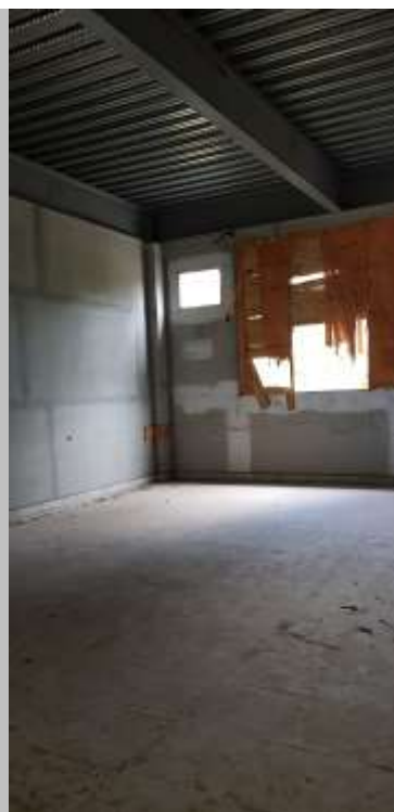
Sala de aula 03 (40 alunos)