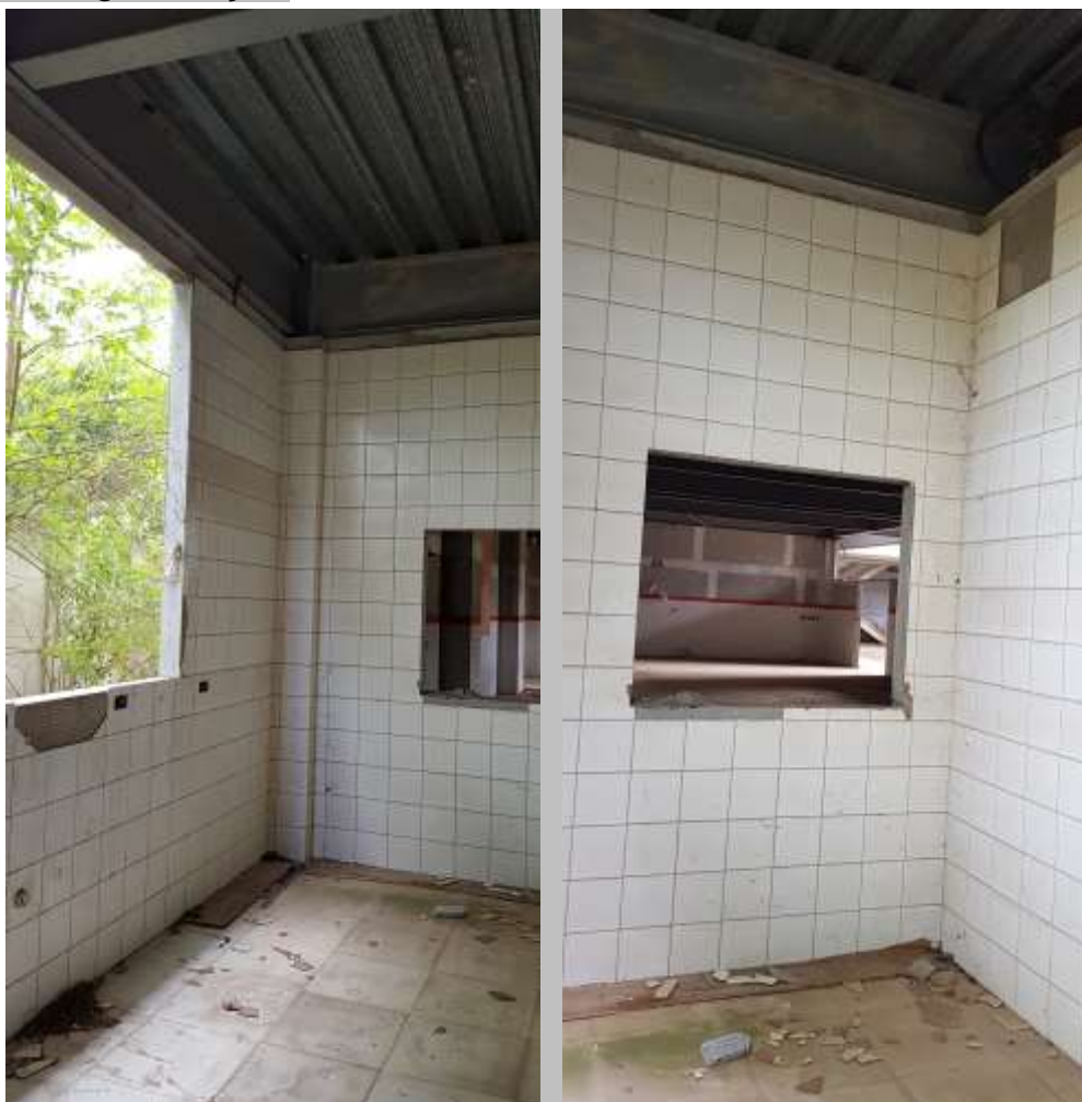
Vista interna da higienização e ao fundo o passa prato para o refeitório

Piso: Piso cerâmico antiderrapante: Executado