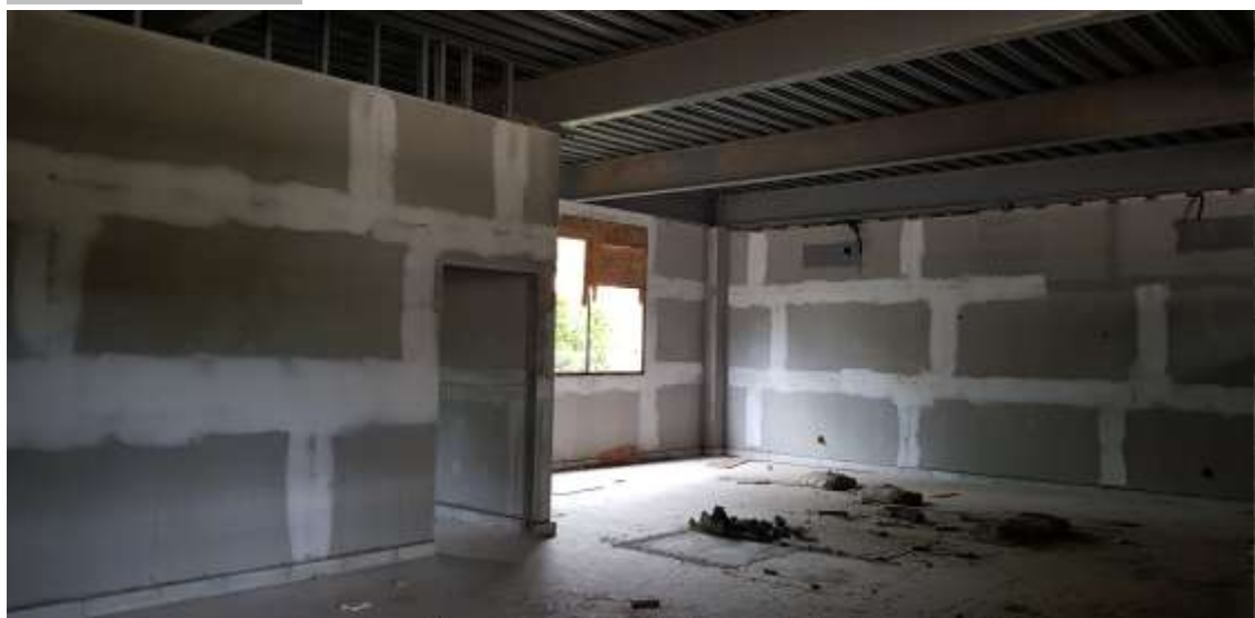
Vista interna da Biblioteca

Piso: Piso de alta resistência pré-moldado em placas 40x40x3cm e rodapé h:10 cm do mesmo material: Executado (Refazer o polimento devido à paralisação da obra)