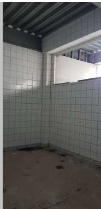
Depósito de materiais

Piso: Piso de alta resistência pré-moldado em placas 40x40x3cm e rodapé h:10 cm do mesmo material: Executado (Refazer o polimento devido à paralisação da obra)