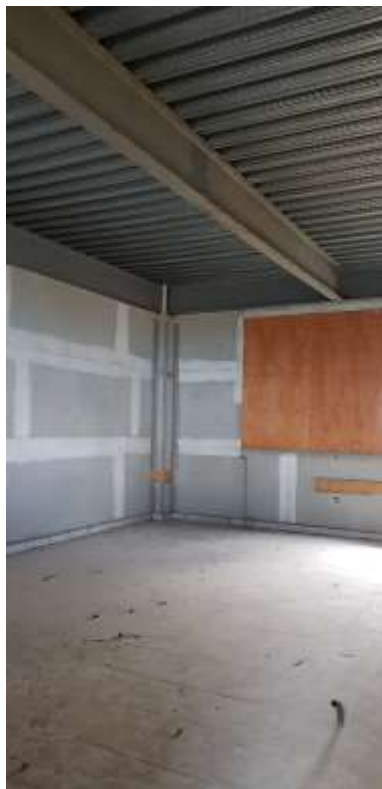
Laboratório de ciências e física

Piso: Piso de alta resistência pré-moldado em placas 40x40x3 e rodapé h=10cm do mesmo material: Executado (Refazer o polimento devido à paralisação da obra)