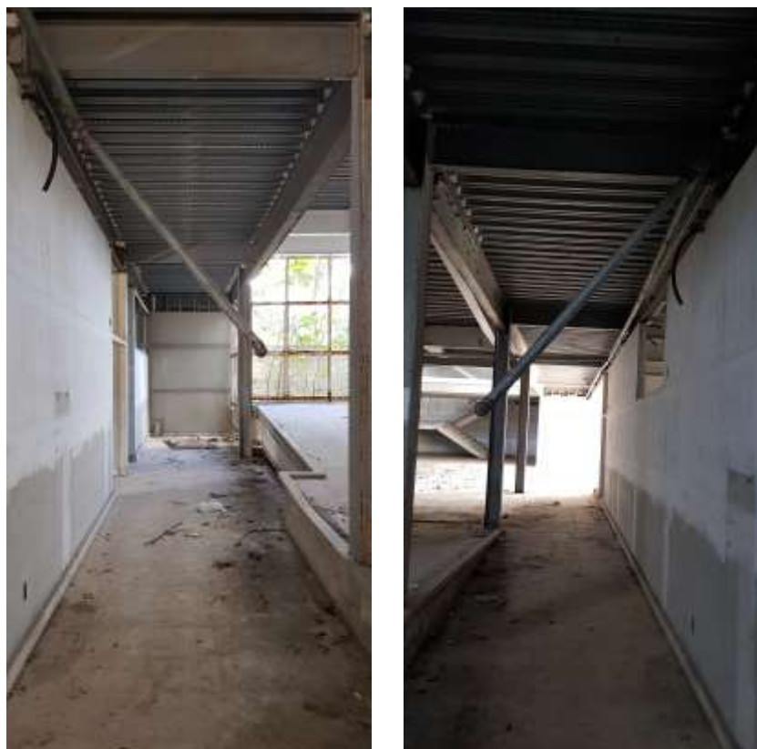
Circulação de acesso ao auditório

C.E. CARLOS WALTER MARINHO CAMPOS (CE EM LAGOMAR)