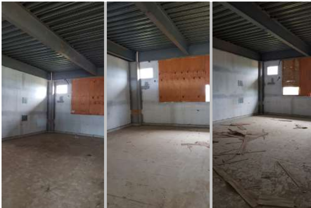
Sala de aula 11 (40 alunos) Sala de aula 12 (40 alunos) Sala de aula 13 (40 alunos)

C.E. CARLOS WALTER MARINHO CAMPOS (CE EM LAGOMAR)