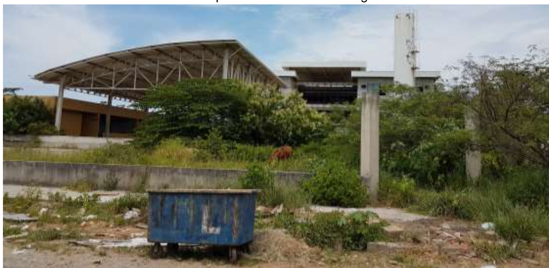
Vista externa da entrada do prédio