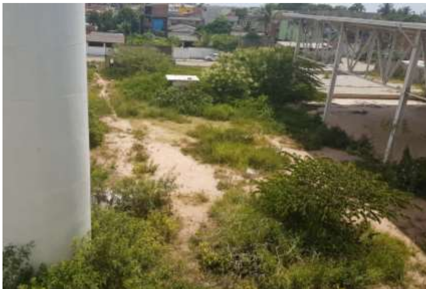
Vista superior do terreno com as entradas do bloco principal e quadra