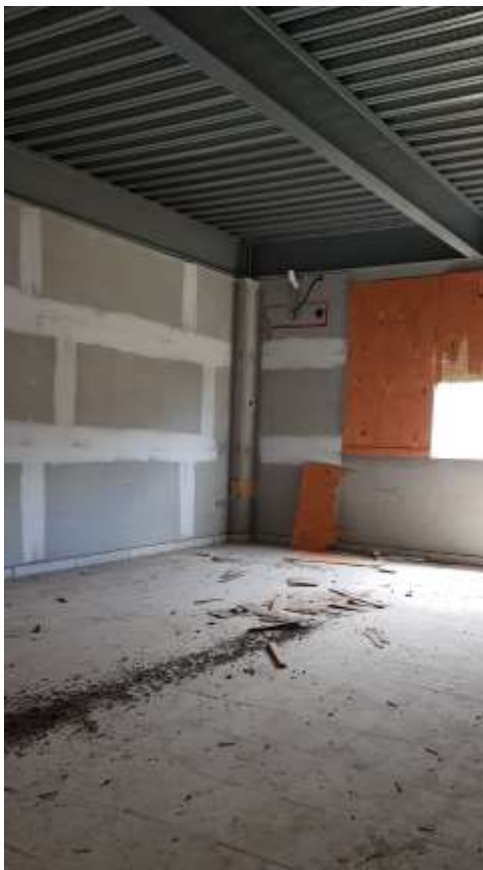
Vista interna da sala de artes

Piso: Piso de alta resistência pré-moldado em placas 40x40x3 e rodapé h=10cm do mesmo material: Executado (Refazer o polimento devido à paralisação da obra)