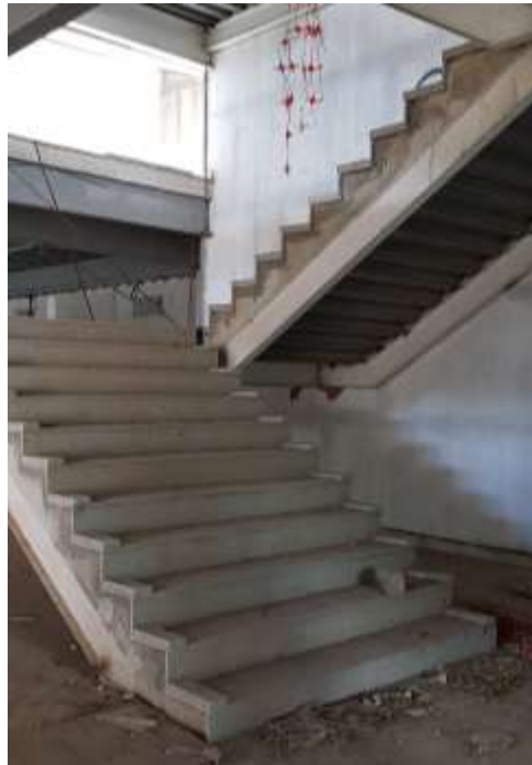
Vista do primeiro lance da escada

Piso: Granito não polido em placas 40x40x3: Executado