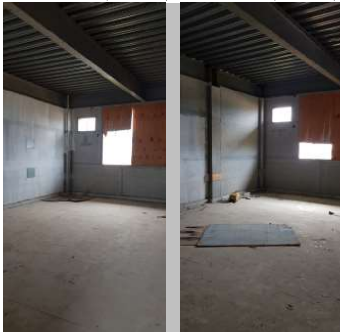
Sala de aula 19 (40 alunos) Sala de aula 20 (40 alunos)