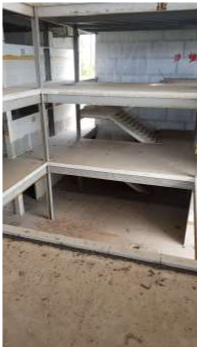
Vista superior do prisma central

C.E. CARLOS WALTER MARINHO CAMPOS (CE EM LAGOMAR)