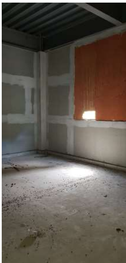
Vista interna do arquivo

Piso: Piso de alta resistência pré-moldado em placas 40x40x3cm e rodapé h:10 cm do mesmo material: Executado (Refazer o polimento devido à paralisação da obra)