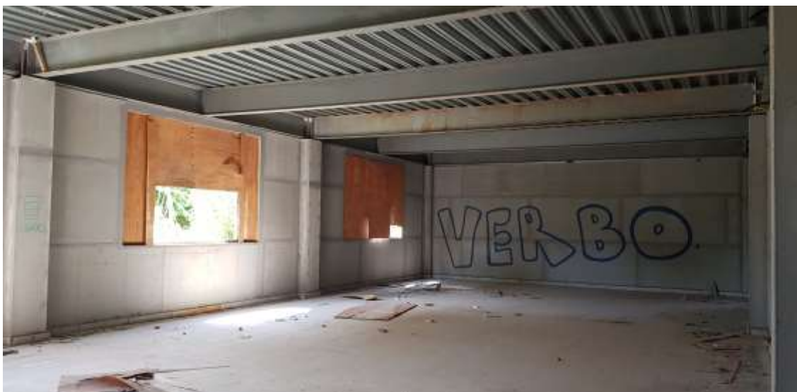
Vista interna do Auditório

Piso: Piso de alta resistência pré-moldado em placas 40x40x3cm e rodapé h:10 cm do mesmo material: Executado (Refazer o polimento devido à paralisação da obra)