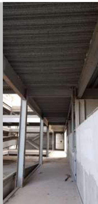
Circulação das salas de aula