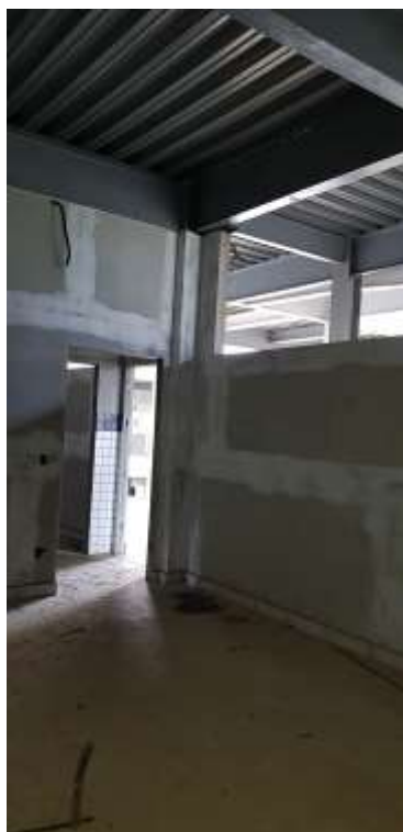
Sala dos professores

(SOE, sala de professores, coordenação pedagógica e direção)