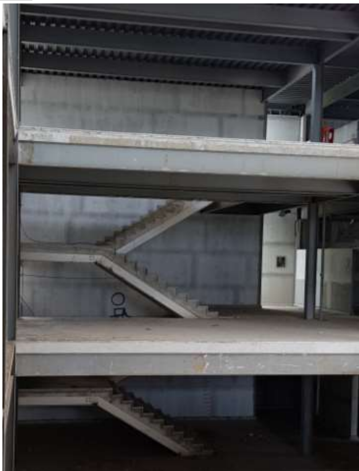
Escada 2º pavimento

Piso: Granito não polido em placas 40x40x3: Executado