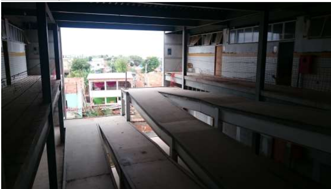
Vista superior da rampa

Instalação de Guarda corpo de aço inox no prisma, em torno da escada e rampa: A Executar