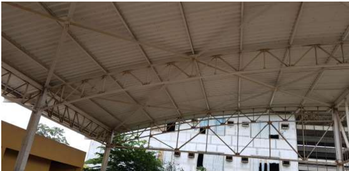
Vista da estrutura metálica e cobertura da quadra

C.E. CARLOS WALTER MARINHO CAMPOS (CE EM LAGOMAR)