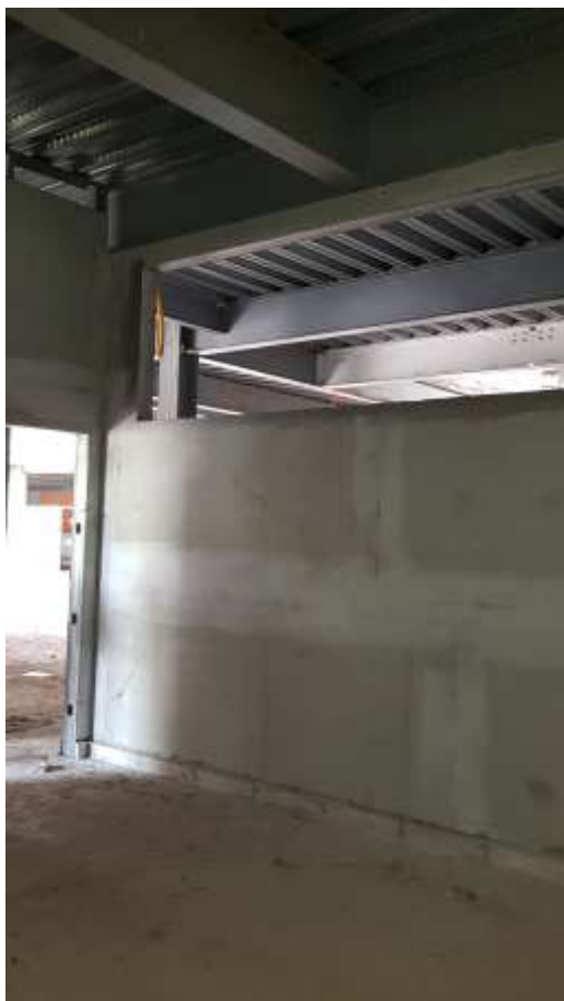
Vista interna do grêmio

Colocação de luminárias de embutir: A Executar