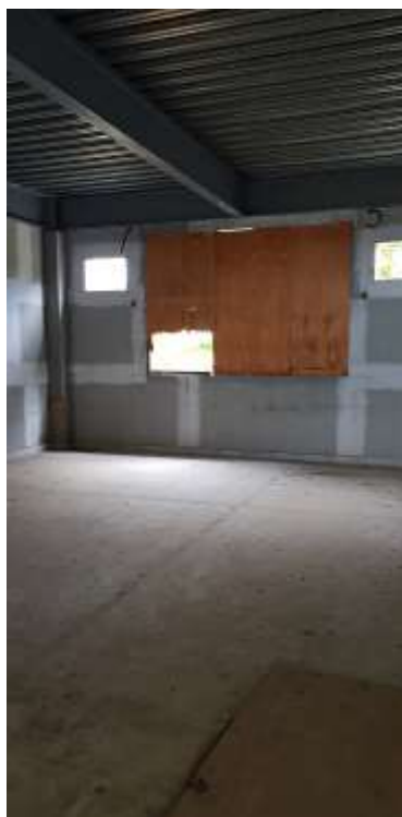
Sala de aula 01 (40 alunos)