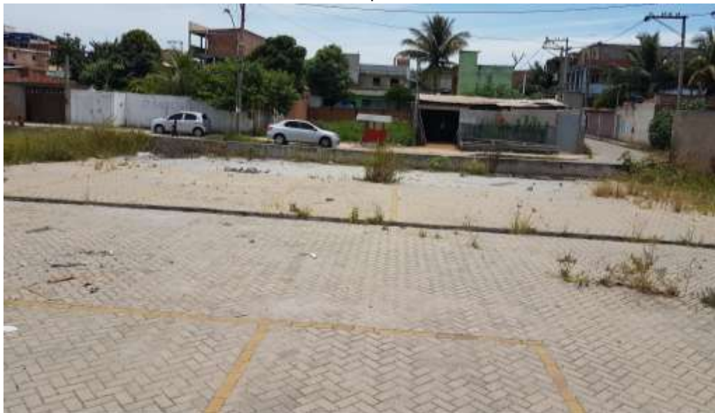
Vista da posterior do estacionamento

Piso: Piso em blocos de concreto pré-moldado tipo intertravado h=10 cm natural. Executado parcialmente (Trecho furtado que deverá ser repostado)