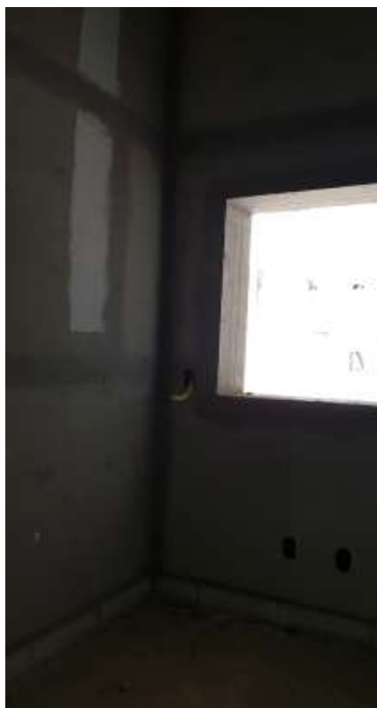
Vista interna da portaria

Piso: Piso de alta resistência pré-moldado em placas 40x40x3cm e rodapé h:10 cm do mesmo material: Executado (Refazer o polimento devido à paralisação da obra)