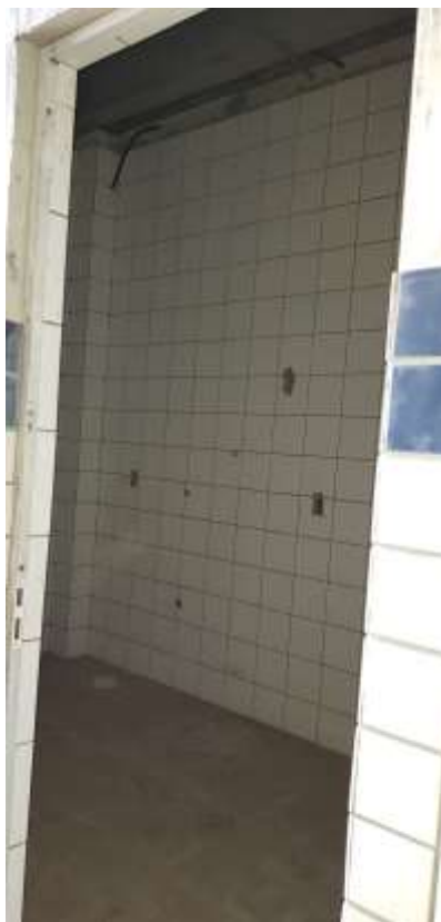
Copa dos funcionários

Piso: Piso cerâmico antiderrapante: Executado