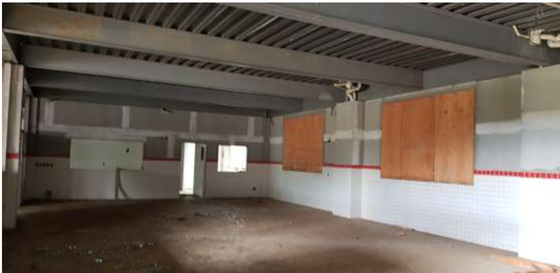
Vista interna do refeitório e ao fundo acesso à cozinha e higienização

Colocação de luminárias de embutir: A Executar