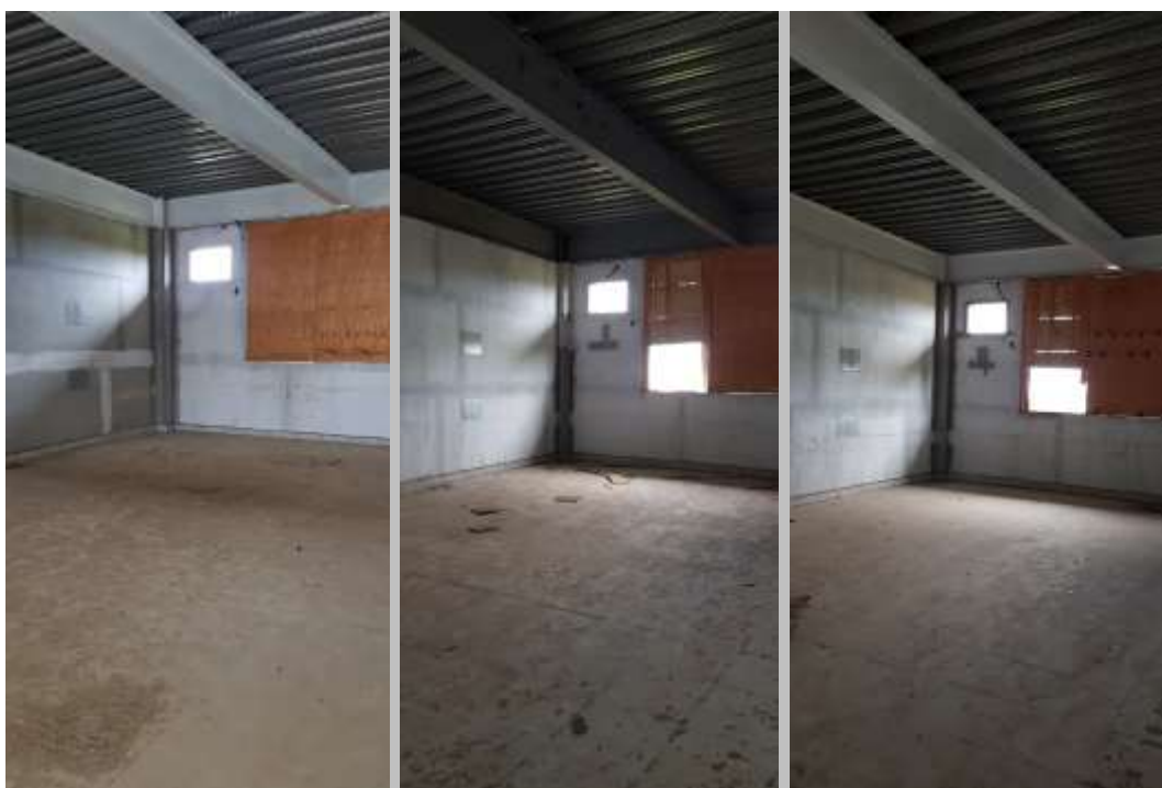
Sala de aula 08 (40 alunos) Sala de aula 09 (40 alunos) Sala de aula 10 (40 alunos)