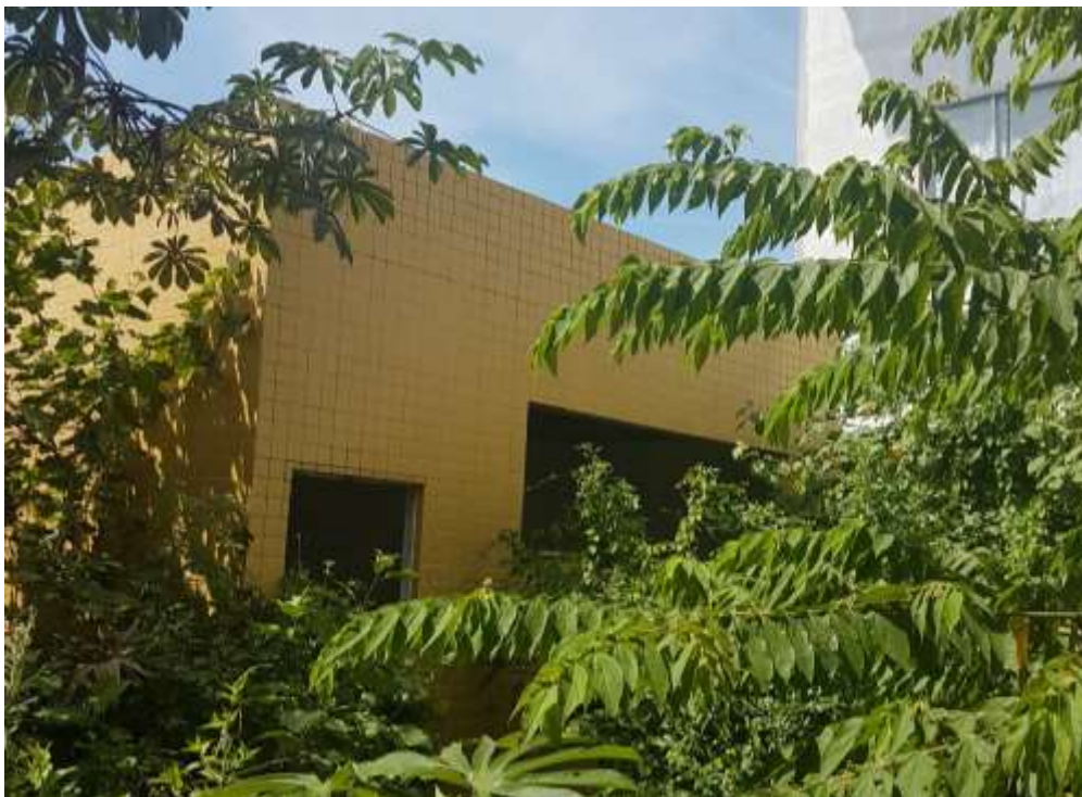
Vista frontal do depósito de resíduos

Piso: Piso cerâmico 40x40 antiderrapante: Executado