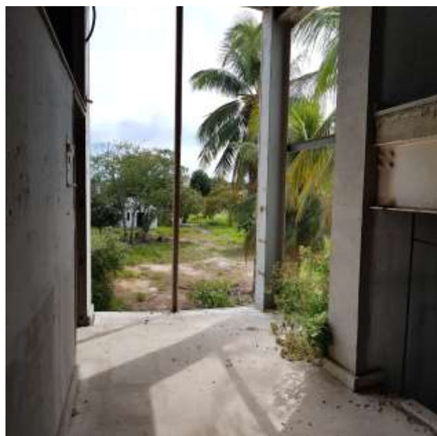
Circulação das salas de aula