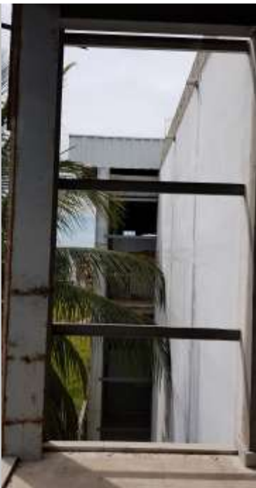
Circulação das salas de aula