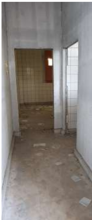
Circulação dos depósitos