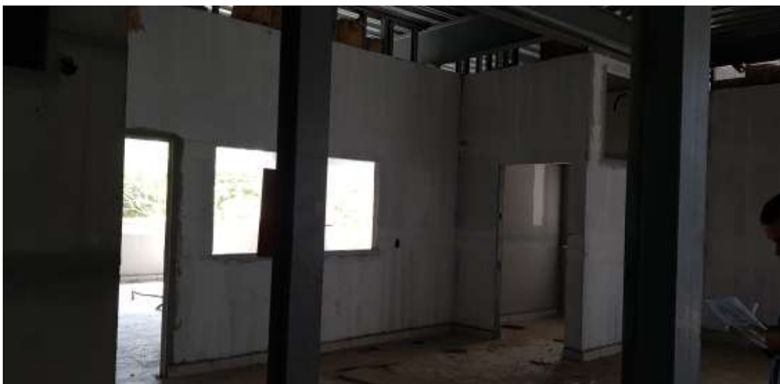
Circulação com a entrada da secretaria e portaria