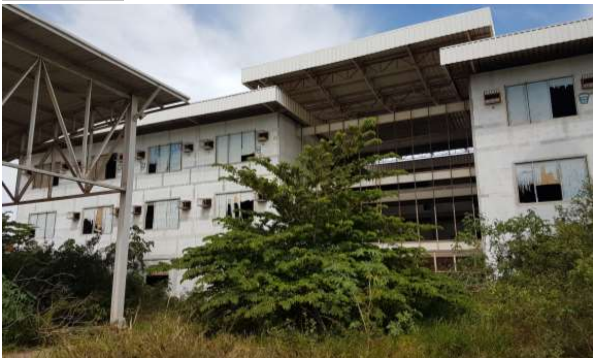
Vista da fachada frontal do Bloco Principal

Parede: Pintura acrílica nas fachadas: A Executar