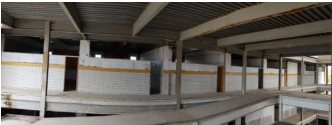
Circulação das salas de aula