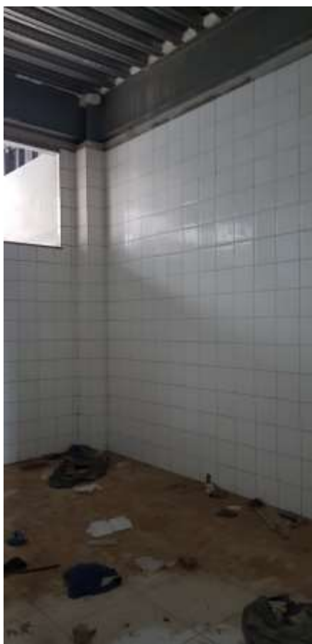
Vista interna do depósito

Colocação de bancada em aço inox com torneira: A Executar