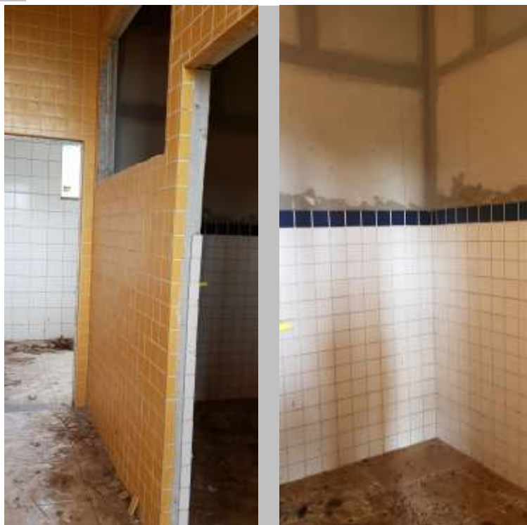
Circulação do depósito/vestiário e Vista interna do depósito

Piso: Piso cerâmico antiderrapante: Executado