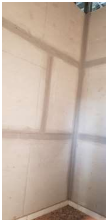
Circulação da sala dos professores/vestiário e Vista interna do depósito

Piso: Piso cerâmico antiderrapante: Executado