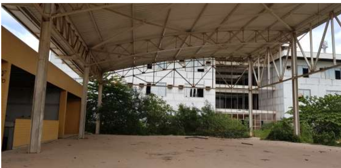
Vista interna da Quadra Poliesportiva