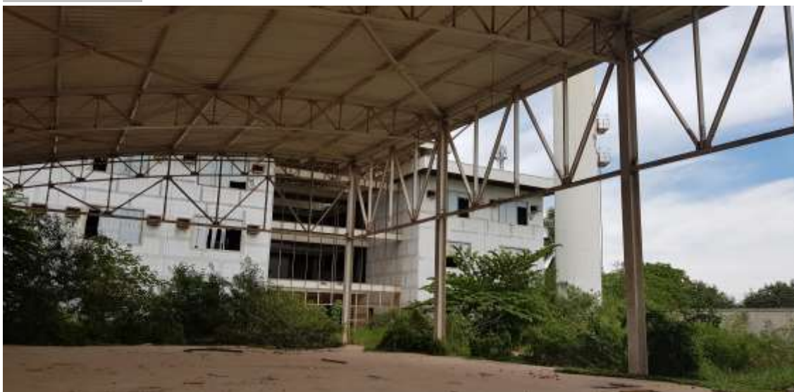
Vista da Quadra para a fachada do Bloco Principal