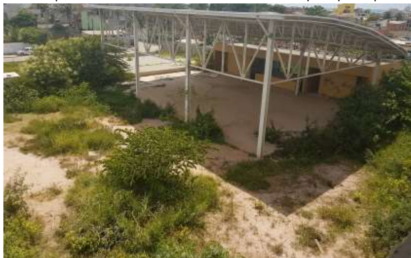
Vista superior do terreno com a entrada da quadra poliesportiva e entrada de serviço