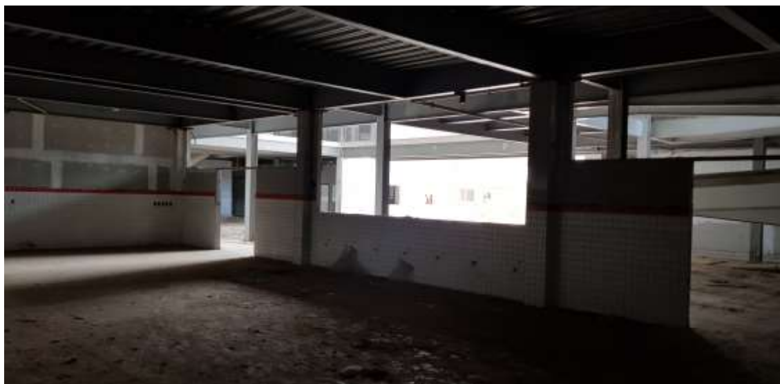
Vista interna do refeitório com os acesso pelo pátio coberto

Empresa de Obras Públicas do Estado do Rio de Janeiro