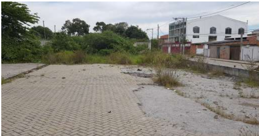
Vista da lateral do estacionamento com parte do trecho do intertravado furtado