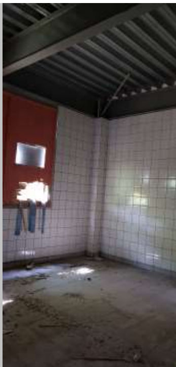
Depósito de material escolar