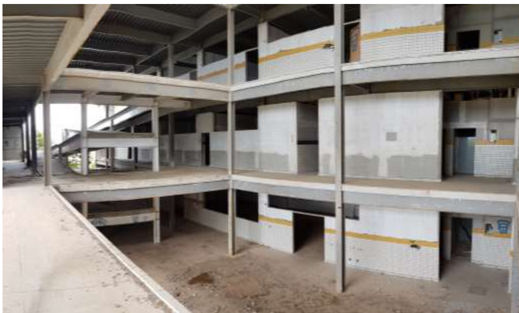
Circulação em torno do prisma

C.E. CARLOS WALTER MARINHO CAMPOS (CE EM LAGOMAR)