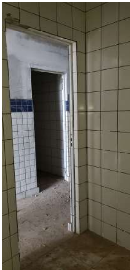
Depósito de material de limpeza (DML)

Piso: Piso cerâmico antiderrapante: Executado