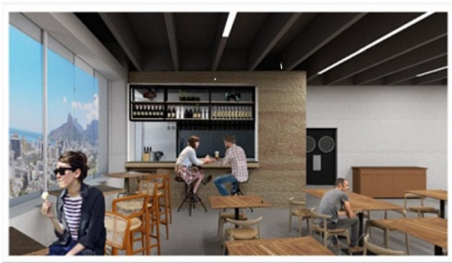
perspectiva bar – imagem meramente ilustrativa

Considerando a atividade finalística desta Empresa Pública, alínea “c”, inciso I do art. 3º do Estatuto da EMOP-RJ.