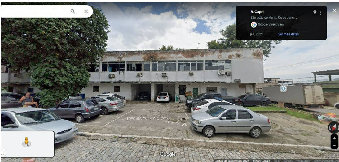
Figura 2 - Fachada do edifício/imóvel da antiga 64ª Delegacia de Polícia, vista pela rua Capri. FONTE: Google Maps. Acesso em: 26/09/2023.

Por isso, a parte demarcada do referido imóvel, localizada na esquina das ruas Capri e Rua Pastor Joaquim Rosa foi alocada para a implantação da "Delegacia de Descoberta de Paradeiros" ou DDPa, conforme demonstra Planta de situação do Projeto Básico (index 34738081) - Figura 3 abaixo: