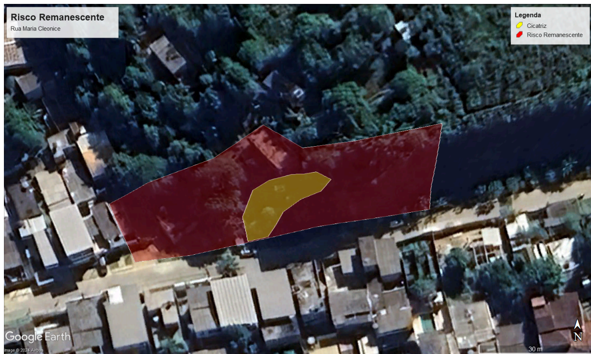
Figura 3. Delimitação do polígono de Risco Remanescente segundo metodologia do DRM-RJ.

O DRM-RJ considera que medidas de gestão de desastre devam ser tomadas em caráter de urgência, visto que o avanço do movimento gravitacional de massa poderá acarretar em danos e prejuízos às moradias e à população. Sendo assim, recomenda-se, a fiscalização e monitoramento do local, bem como a adoção de medidas mitigadoras e a avaliação de um profissional técnico habilitado para a adoção de obras de geotecnia cabíveis, visando a redução de riscos de acidentes.