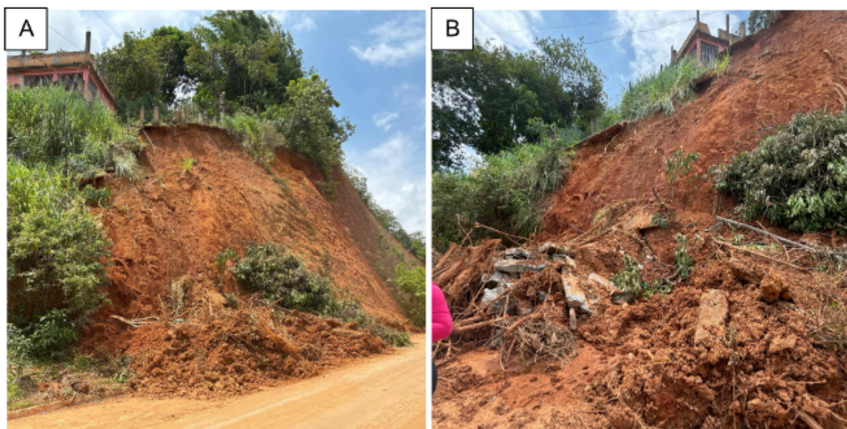
Figura 1. (A) Visada lateral da escada colapsada. (B) Visada inferior da escada colapsada.

A Rua Maria Cleonice (Rua Dona Maria Cleonice Russo), está inserida paralelamente a um corte de estrada de aproximadamente 16 metros de altura e inclinação 60°, com vegetação predominante gramínea e arbustiva e árvores de grande porte no topo do talude. Próximo ao corte do talude, está localizada uma residência a aproximadamente 10 metros de altura, onde a única escada de acesso, encaixada lateralmente neste, colapsou durante as chuvas do dia 21 de fevereiro ( Figura 1 ), Segundo relatos, os moradores só puderam ser retirados do imóvel com apoio de bombeiros. Houve mobilização de material composto por solo argilo-arenoso da porção oeste deste corte, causando o fechamento temporário da via ( Figura 2. A ). Na porção central do corte, foram encontradas feições erosivas ( Figura 2. B ).