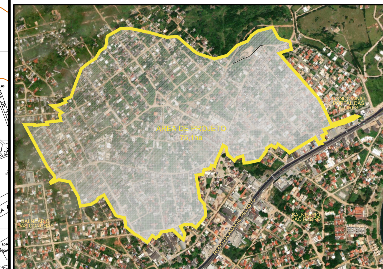
1 PLANTA DE LOCALIZAÇÃO