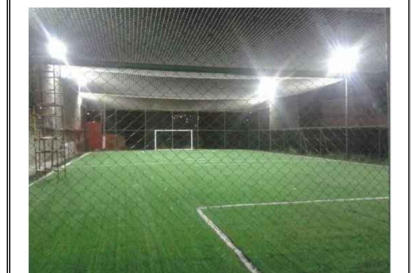
OBS.: PREFERÊNCIA POR TELA DE FECHAMENTO NA COR VERDE