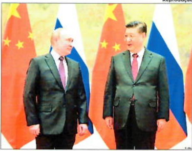
Exercício em conjunto contou com menos soldados

Por outro lado, de acordo com o The Washington Post, o exercício militar que começou