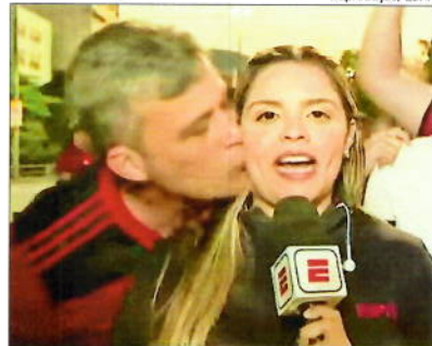
Homem beijou a repórter sem permissão ao vivo

Dias teria pedido que Benevides se acalmasse e parasse com os xingamentos e então o torcedor se desculpou, mas colocou a mão no ombro da jornalista e deu um beijo. O caso aconteceu antes da partida da semifinal da Copa Libertadores.