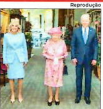
Líderes se despedem

Décimo quarto presidente dos Estados Unidos a ocupar o posto durante o reinado da Elizabeth 2ª, Joe Biden afirmou, em nota de pesar pela morte da britânica na quinta, que ela "foi mais que uma monarca, definiu uma era". "Em um mundo em constante mudança, ela foi uma presença estabilizadora e fonte de conforto e orgulho", diz o texto assinado pelo presidente e pela primeira-dama, Jill Biden.