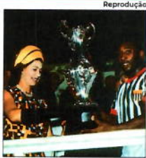
Realezas se encontraram

Em 10 de novembro de 1968, a Rainha Elizabeth II e o Príncipe Phillip vieram ao Maracanã para conhecer o Rei Pelé em um jogo da Seleção Carioca 2 x 3 Seleção Paulista. O escrete carioca era formado praticamente por jogadores do Botafogo, enquanto a base dos paulistas era o time do Santos. Após o apito final, o Rei do Futebol recebeu o troféu diretamente das mãos da Rainha da Inglaterra, que faleceu nesta quinta-feira (8).