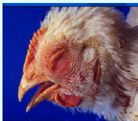
Conjuntivite, inchaço da cabeça e pescoço