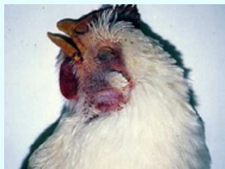
Crista e barbela com coloração roxo azulada