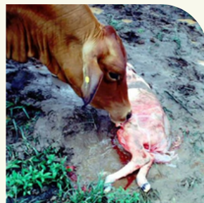
Aborto (em torno do 7º mês de gestação)