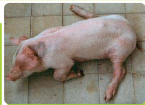
Paralisia de posterior ou posição de cão sentado