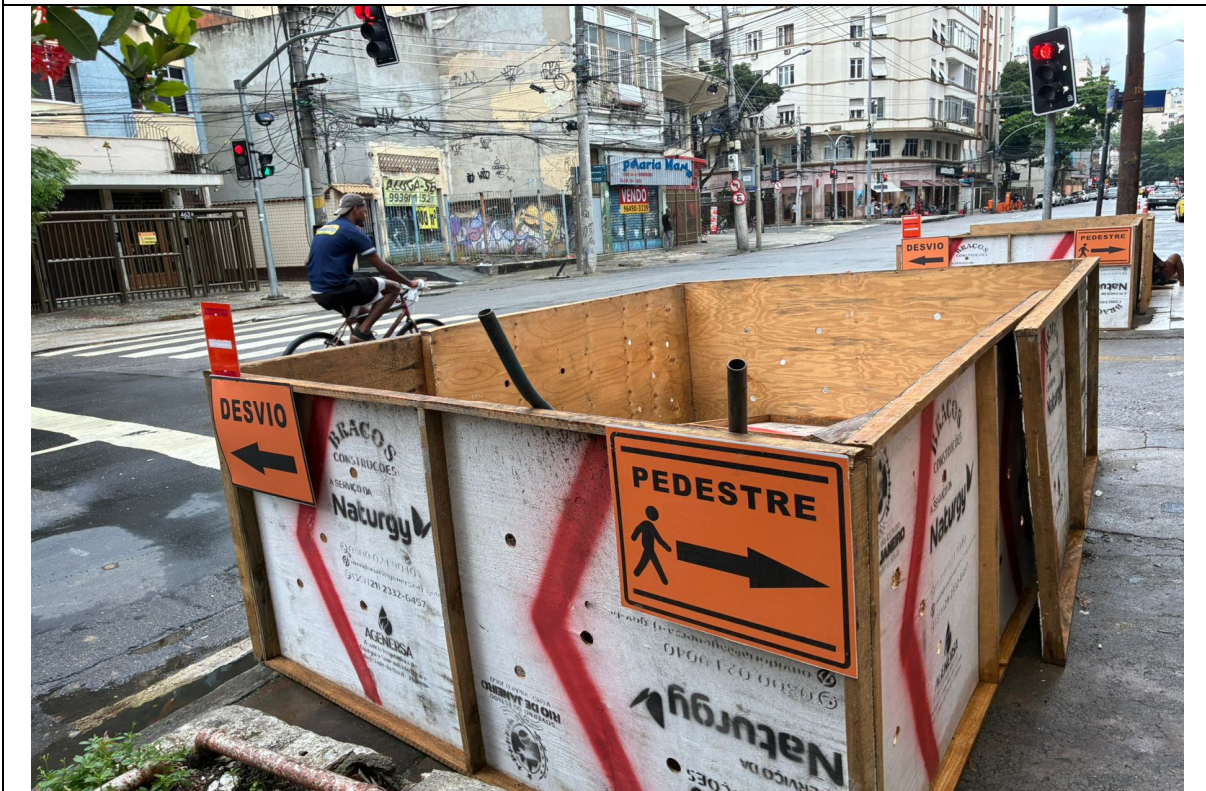
Foto 2: Área de depósito de material provisória, será escavada para troca de ramal.