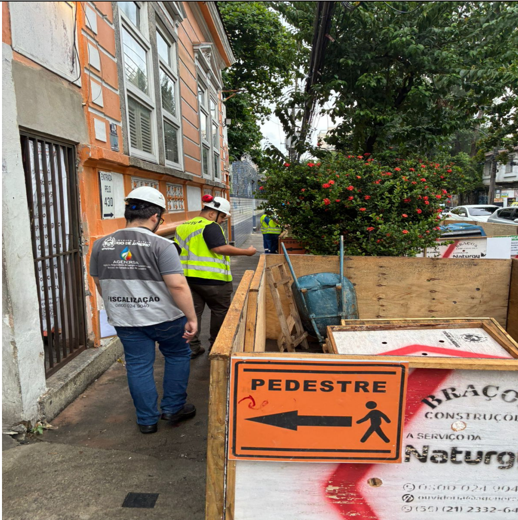
Foto 7: Fim dos trechos em intervenção na Mariz e Barros, pouco depois da Rua Ibituruna. Obra deve avançar a partir deste ponto.