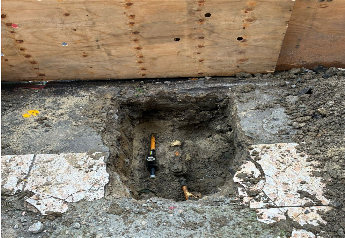
Foto 5: Ramal novo instalado à esquerda, aguardando conexão. Ramal antigo à direita, será abandonado.