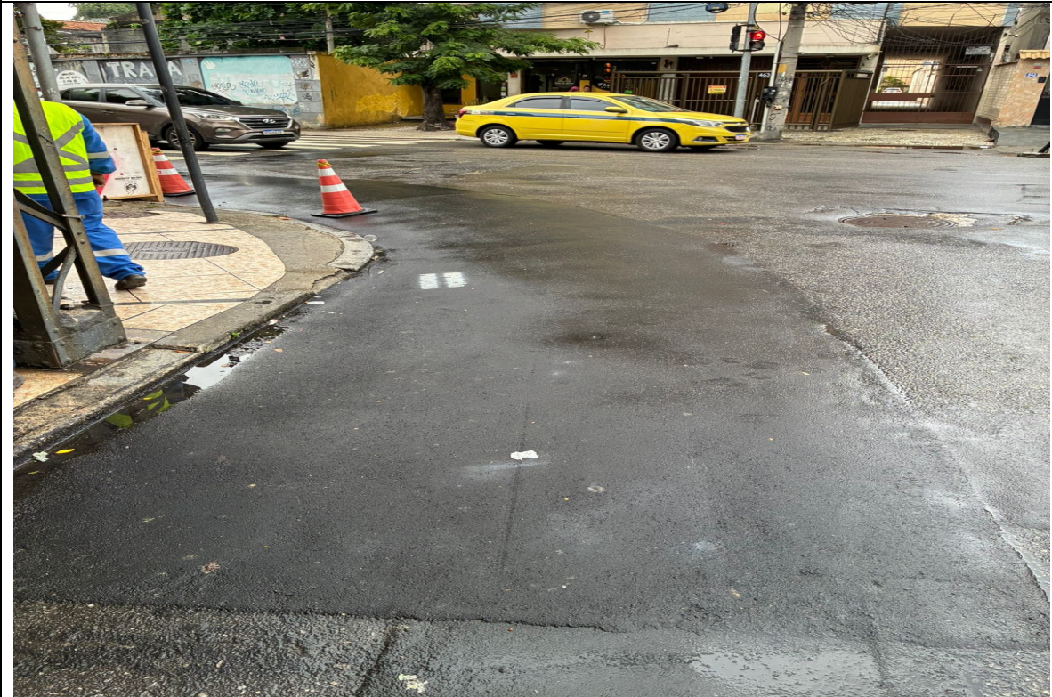
Foto 3: Trecho de reconposição provisória na esquina entre a Rua Mariz e Barros e a Rua Ibituruna.