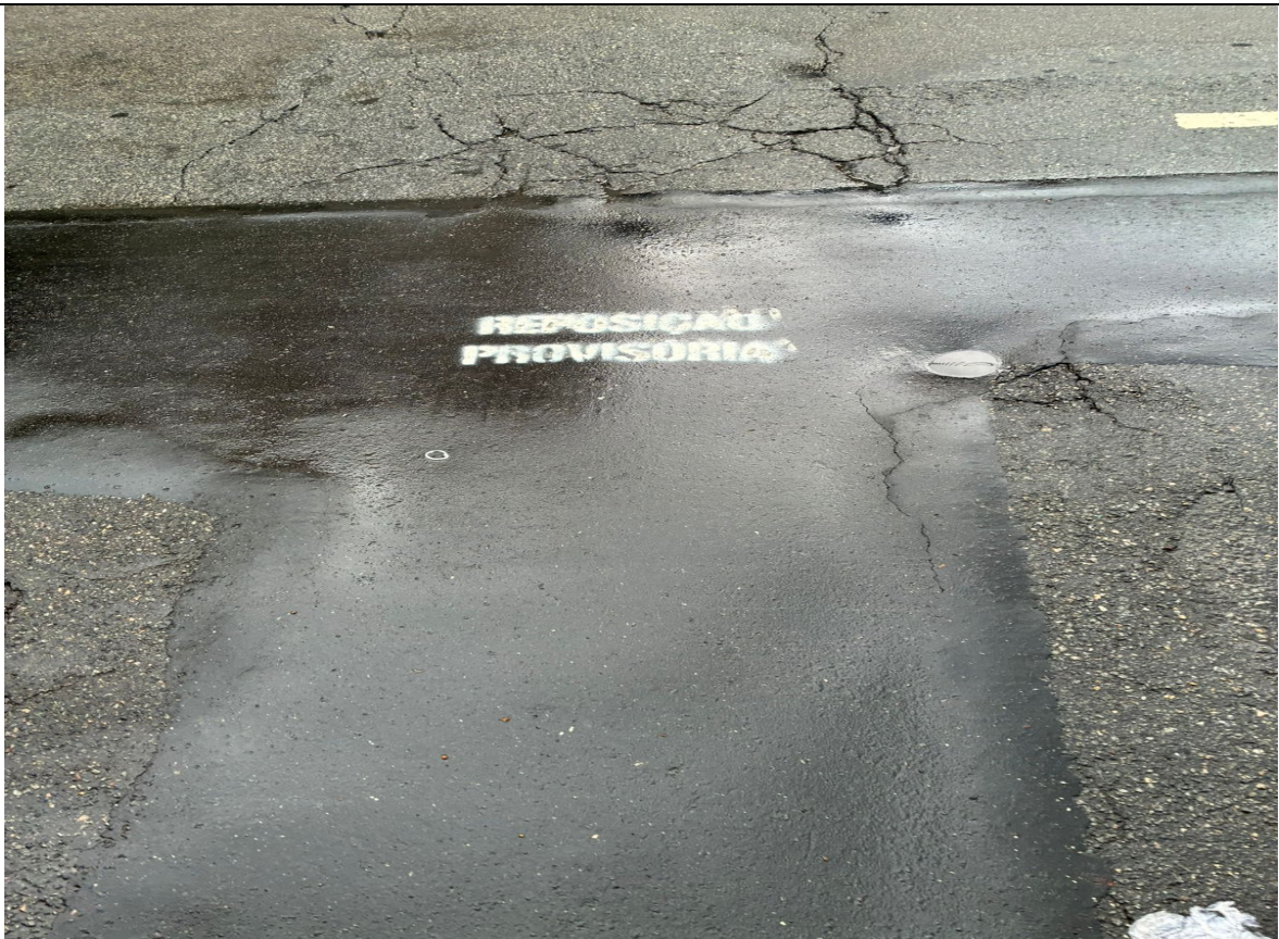
Foto 6: Trecho de recomposição provisória após assentamento. Asfalto da rua já apresentava sinais de desgaste fora das áreas de intervenção.