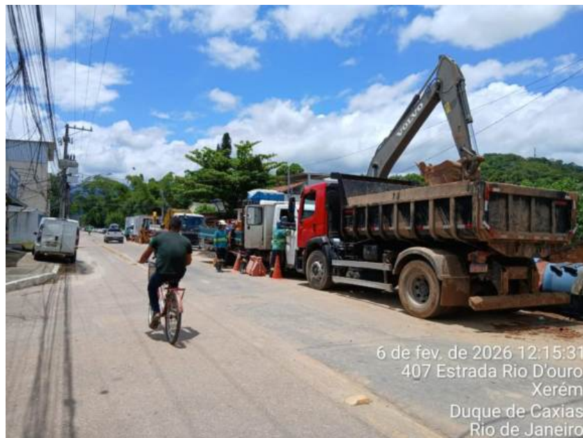
Foto 1 – Retroscavadeira e caminhões munck, de apoio e basculante