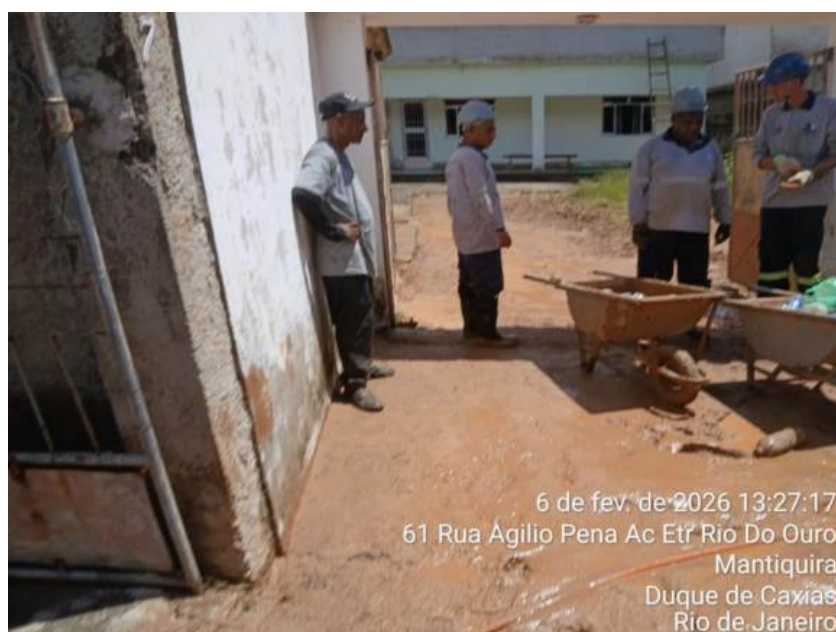
Foto 14 – Funcionários da Concessionária fazendo a limpeza do imóvel