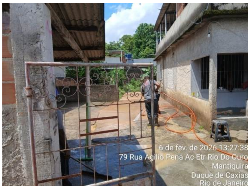
Foto 13 – Funcionários da Concessionária fazendo a limpeza do imóvel