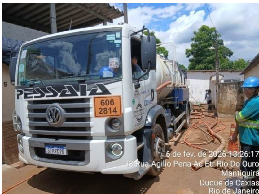
Foto 15 – Caminhão e funcionários da Concessionária limpando o logradouro